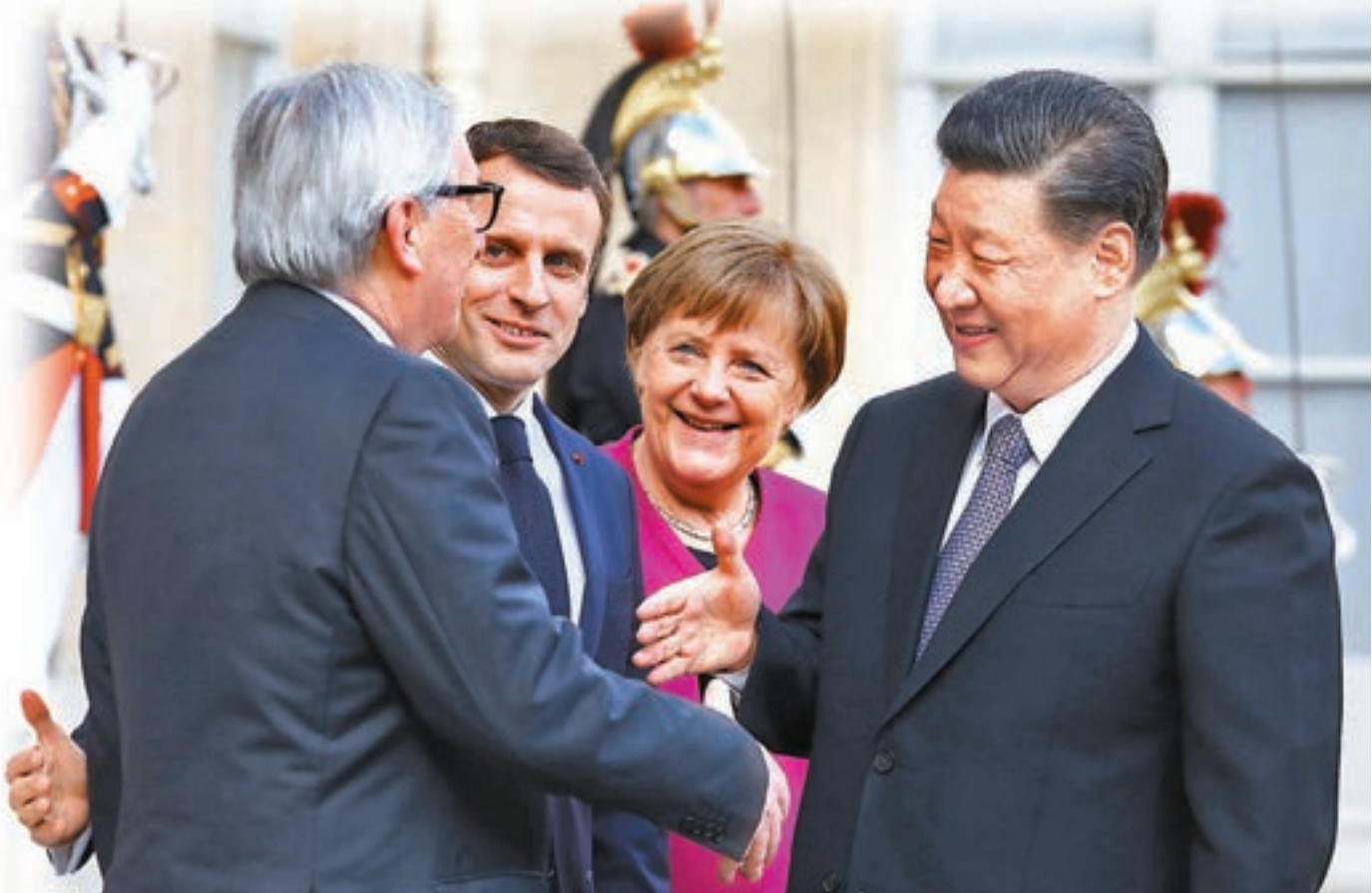
▲習近平同馬克龍一道出席中法全球治理論壇開幕式。默克爾、容克應邀出席。

馬克龍致辭時表示，歐中保持溝通對話對維護多邊主義發揮着不可或缺的作用。歐中在伊朗核問題、氣候變化、非洲安全與發展等領域立場相似，都主張建設強有力、公正的多邊體系，為世界和平和安全作出貢獻。歐中是世界重要力量，要加強戰略互信，以對話方式促進合作。歐方可以創新的方式對接歐盟發展戰略和「一帶一路」倡議，共同促進歐亞互聯互通。 默克爾表示，歐洲國家同中國的良好關係為歐盟同中國開展多邊合作提供了良好基礎。歐方應該加緊推動歐中投資協定談判，積極探討參與「一帶一路」這個重要合作倡議，歐中應該合作維護多邊主義，共商世界貿易組織等多邊機構改革。德國提議明年舉行歐中領導人會晤。 容克表示，歐中是重要戰略合作夥伴。雙方在平等基礎上保持對話非常重要，應該積極推進歐中投資協定談判，並就世界貿易組織改革等重大國際問題保持協調。我期待着即將舉行的歐中領導人會晤取得積極成果。