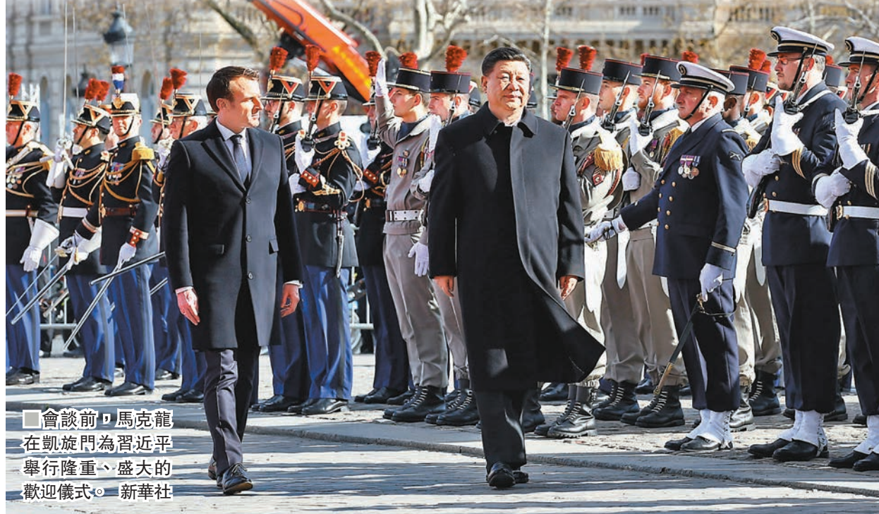
■會談前，馬克龍在凱旋門為習近平舉行隆重、盛大的歡迎儀式。