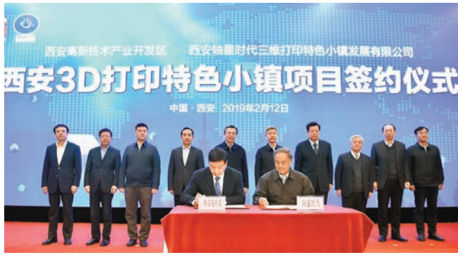
西安3D打印特色小鎮項目簽約儀式現場。

目前陝西3D打印研發生產企業已超過70家,年營業收入5億多元人民幣,產業規模位居全國前列。此次落戶的西安3D打印特色小鎮項目,建設規劃以3D打印核心裝備及航空航天應用為產業重心,同時融