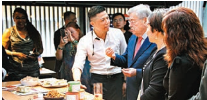
美國駐華大使泰里·布蘭斯塔德出席「舌尖上的美利堅」活動。

香港文匯報訊(記者李兵成都報導)為期3天的第100屆全國糖酒商品交易會日前在成都舉行,來自全球40餘個國家和地區的4,000家廠商參展。