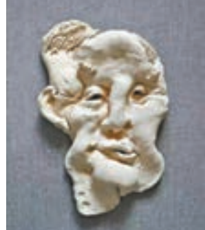
劉君湘作品《老爹》（陶瓷）