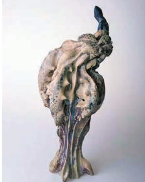
陳瑤作品《叛逆的花》（陶瓷）