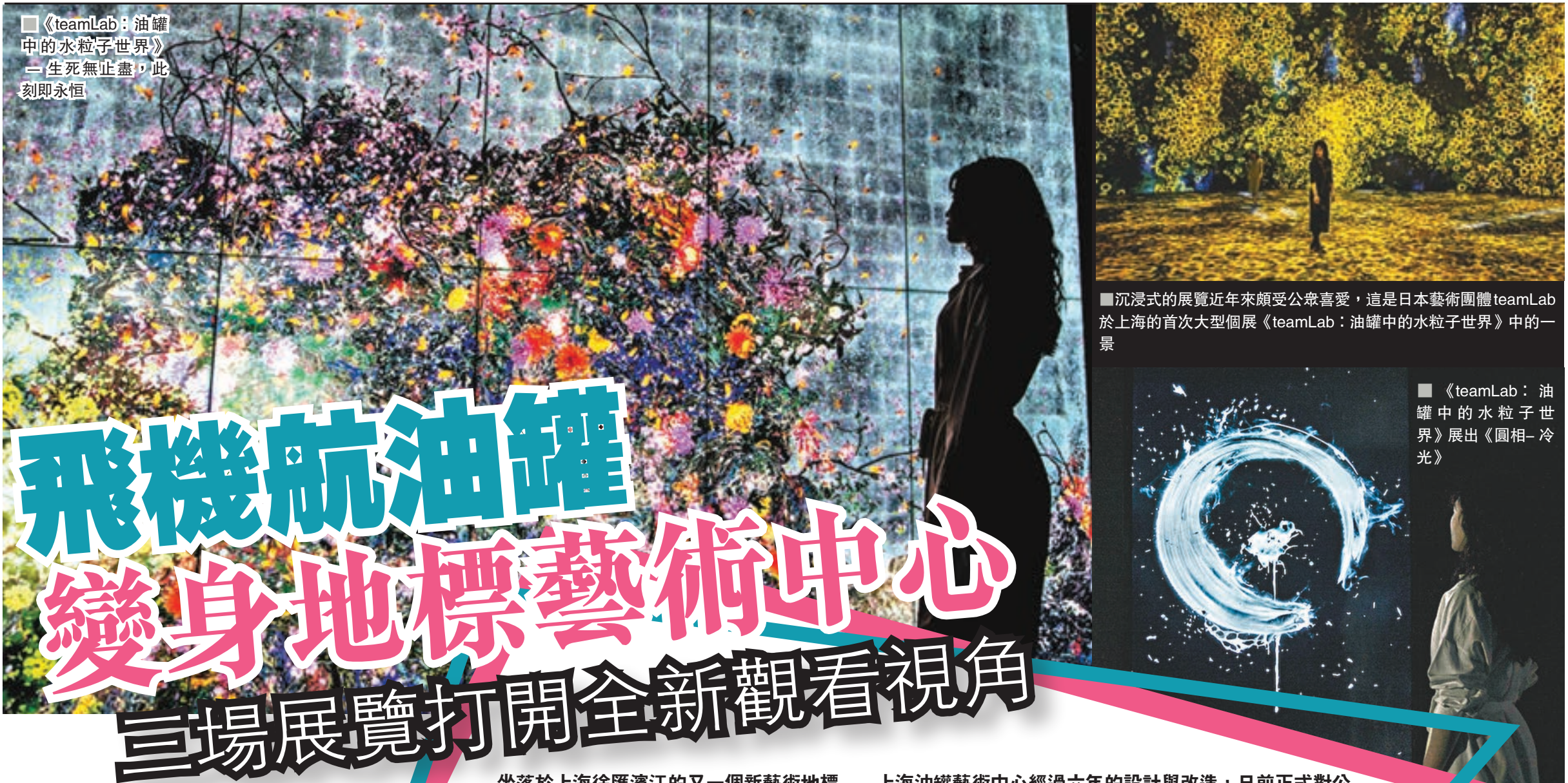
teamLab: 油罐中的水粒子世界 一生死無止盡，此刻即永恒