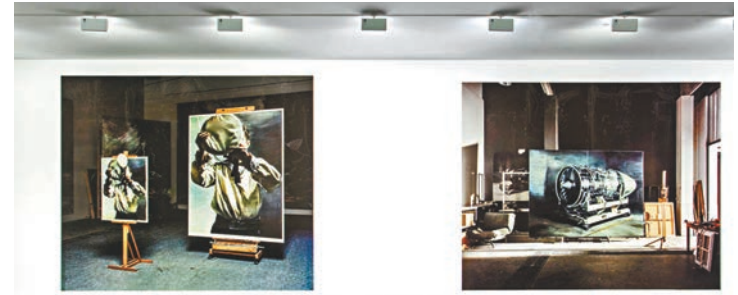
展覽《建立中》的現場