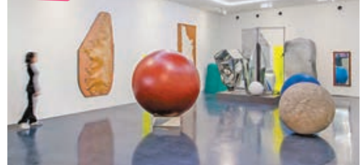
現場不少展品頗具觀賞價值。

「油罐藝術中心希望以小到社區的尺度、大到城市的視野，為上海煥發全新的藝術活力。」在喬志兵的設想裡，油罐藝術中心將同時兼顧惠及本地和面向世界。未來不僅將繼續支持並向全世界展現中國藝術家優秀的創作，還將構建國際藝術文化對話的平台。