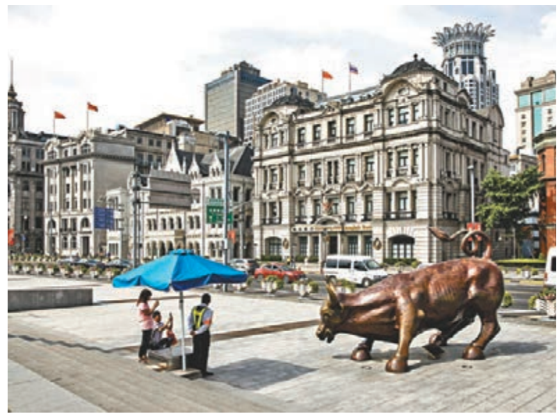
IMF於今年1月，將今年全球經濟增長預測下調至3.5%，但亞洲區仍高達6.3%。圖為上海外灘銅牛雕塑。

環球股市於第一季看似欣欣向榮，MSCI世界指數年初至今已上升超過13%。光大新鴻基認為，近期股市主要源於「估值修復」，即是去年第四季股市因市場過於悲觀而急跌，但隨著多項利好消息出現(例如美國放慢加息步伐)，市場氣氛好轉，從而帶動股市回升。惟環球經濟及企業盈利的放緩趨勢未改，短期內中美貿易談判及英國脫歐問題仍存變數，暫不宜對後市過分樂觀。