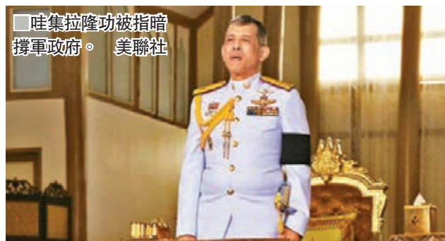
哇集拉隆功被指暗撐軍政府。美聯社