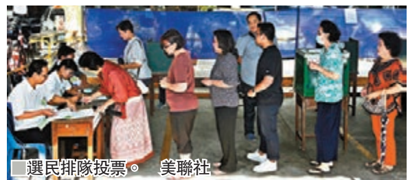
選民排隊投票。