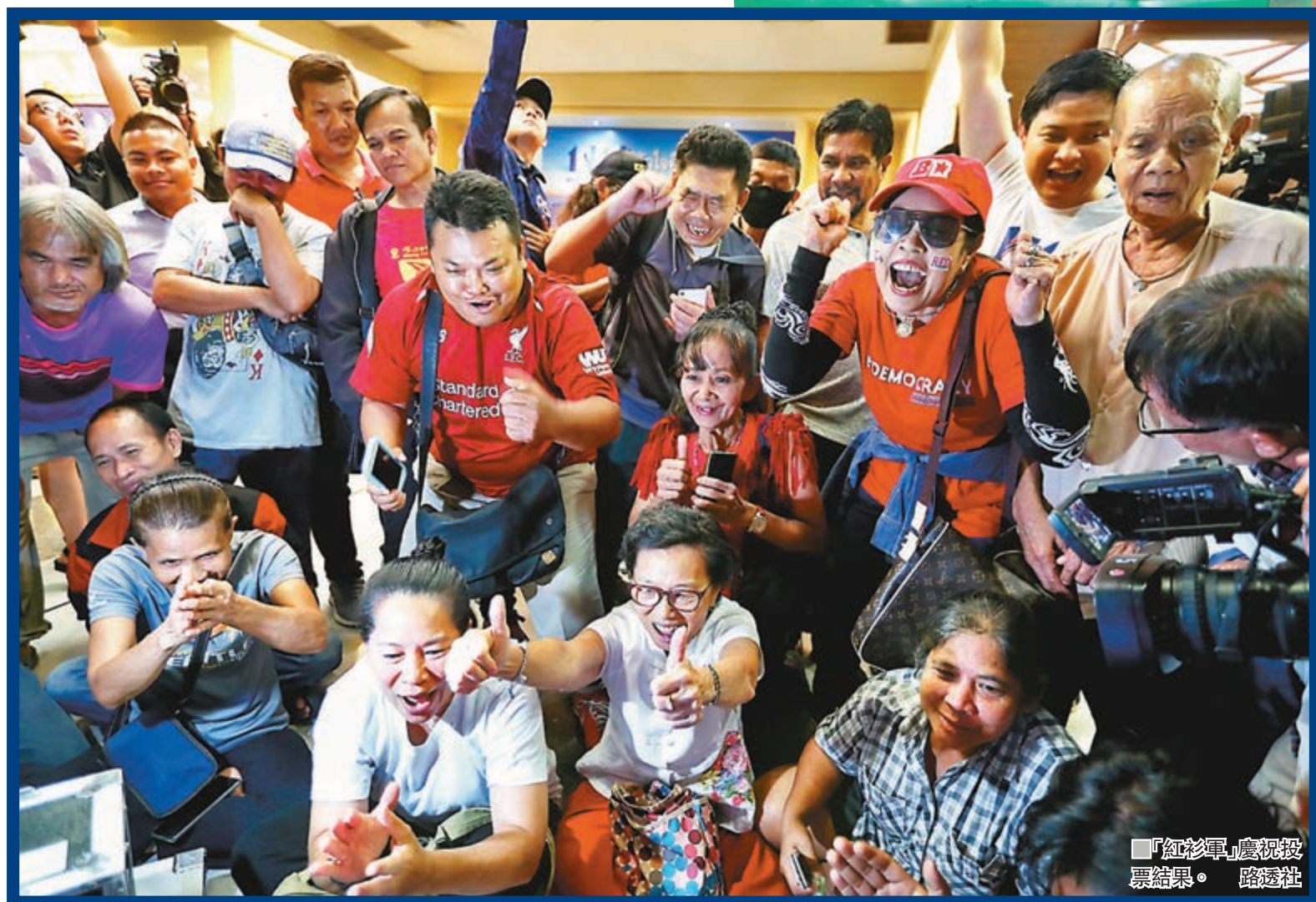
「紅衫軍」慶祝投票結果。