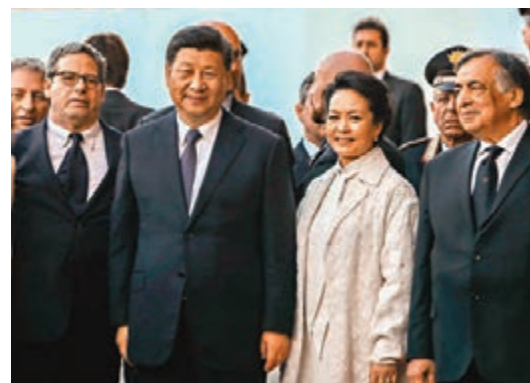
國家主席習近平當地時間23日在巴勒莫會見意大利西西里大區主席穆蘇梅奇(左一)。

香港文匯報訊 據新華社報道，國家主席習近平23日在巴勒莫會見意大利西西里大區主席穆蘇梅奇。西西里大區議會主席、省督、巴勒莫市長等參加會見。