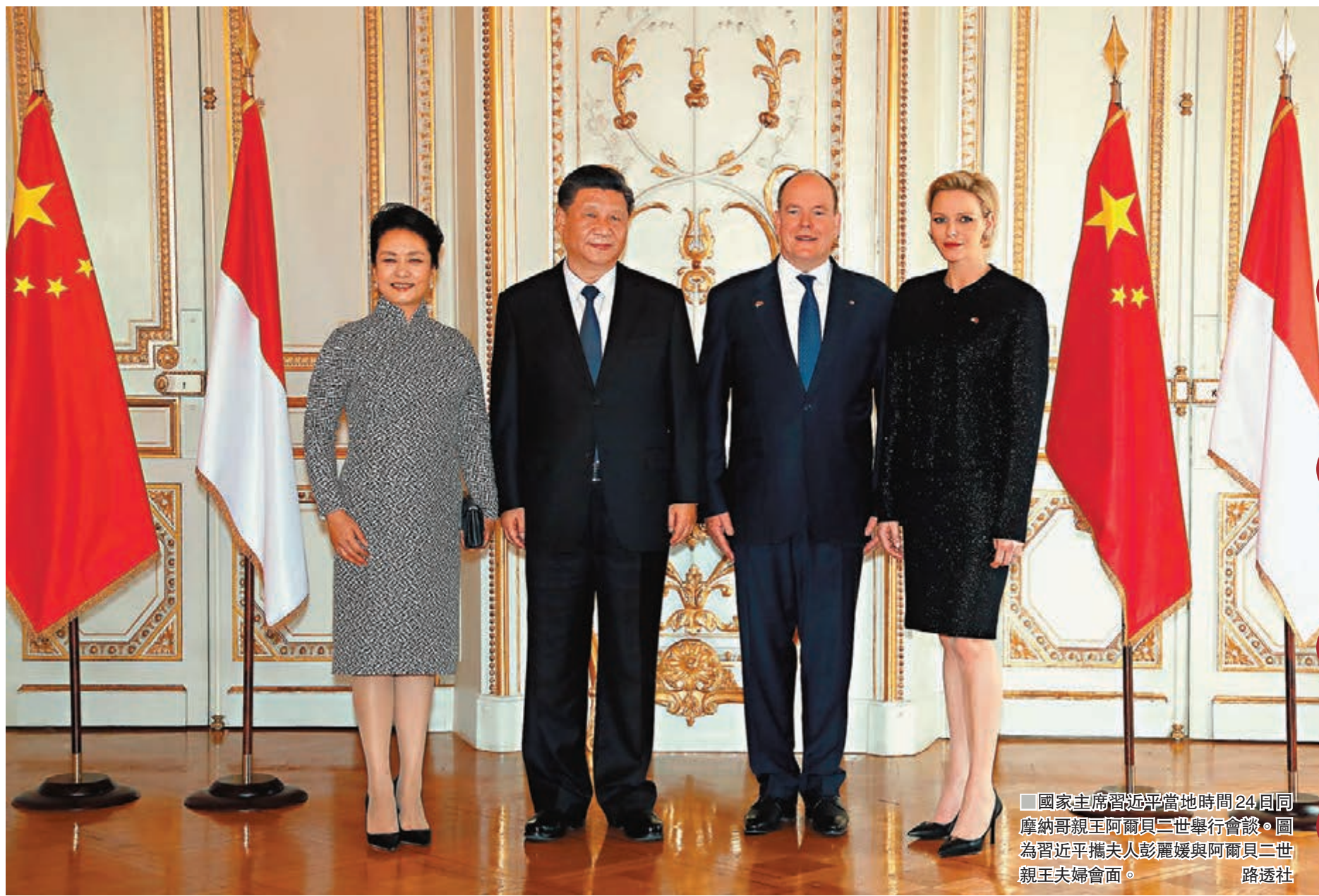
國家主席習近平當地時間24日同摩納哥親王阿爾貝二世舉行會談。圖為習近平攜夫人彭麗媛與阿爾貝二世親王夫婦會面。