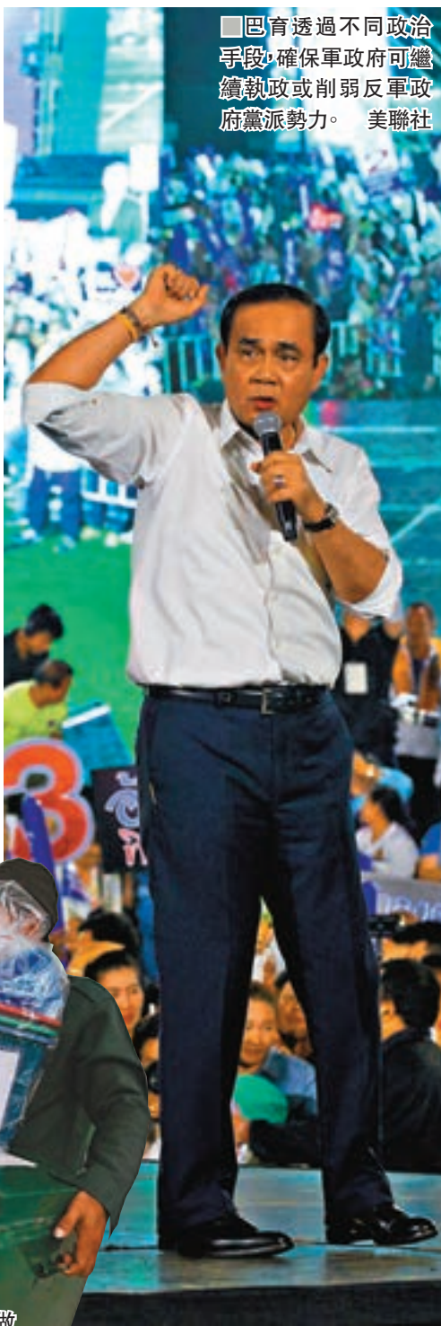
巴育透過不同政治手段，確保軍政府可繼續執政或削弱反軍政府黨派勢力。