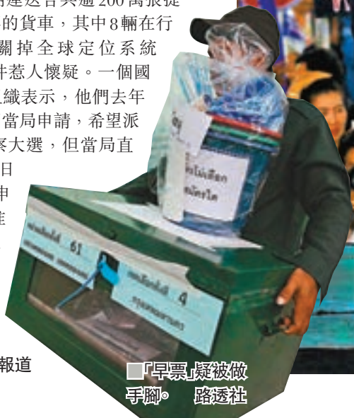
「早票」疑被做手脚。