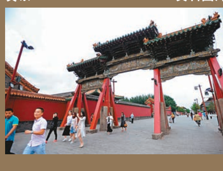
■ 翟金生筆下的瀋陽故宮文德坊還原實景。資料圖片