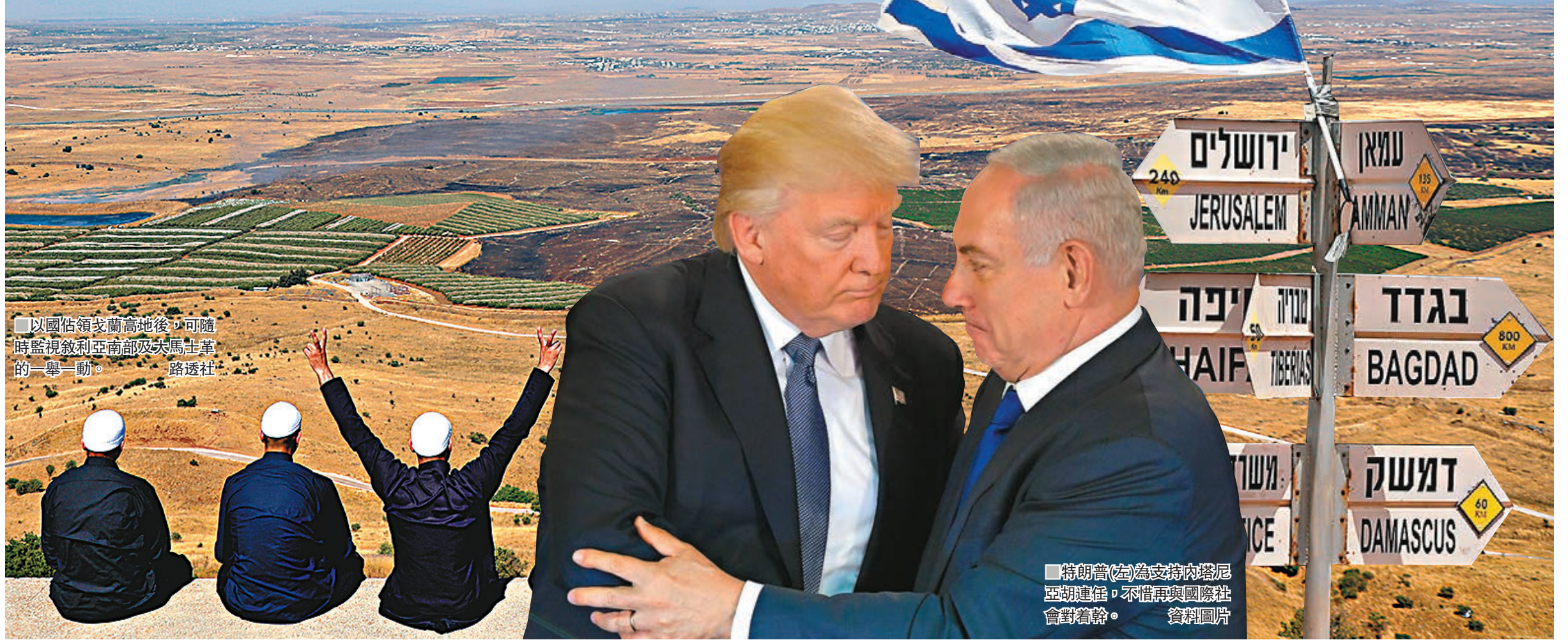
以國佔領戈蘭高地後，可隨時監視敘利亞南部及大馬士革的一舉一動。

美國總統特朗普繼去年不顧國際社會普遍反對，承認耶路撒冷為以色列首都後，前日再在中東問題上「火上加油」，突然表示美國「是時候完全承認」以色列對戈蘭高地的主權，再一次與國際社會的共識背道而馳。以色列總理內塔尼亞胡形容特朗普此舉「歷史性」，作為戈蘭高地主權爭議另一方的敘利亞則強烈譴責特朗普公然違反國際法，盲目支持以色列，阿拉伯聯盟和多個國家亦紛紛炮轟。外界質疑特朗普在以色列4月9日大選前發出這番言論，是要變相為貪腐醜聞纏身的內塔尼亞胡助選。