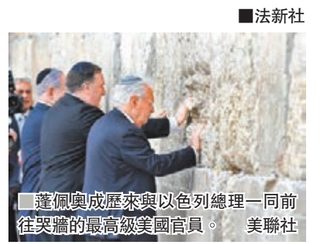
■蓬佩奧與內塔尼亞胡一同前往哭牆的最高級美國官員。

美國總統特朗普曾於2017年5月到訪哭牆，是首位這樣做的在任美國總統，副總統彭斯亦於去年1月到過哭牆，但這兩次訪問都沒有內塔尼亞胡陪同。