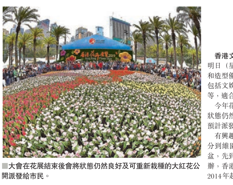
大會在花展結束後會將狀態仍然良好及可重新栽種的大紅花公開派發給市民。

在這些重大道德問題上,《蘋果日報》有任何矯正。在這些重大道德問題上,《蘋果日報》的廣告商有責任向消費者說明是否認同。」 他強調:「全世界自由社會的消費者,完全有權關注商品及服務供應商對重大道德問題的立場,因此集體杯葛超越道德底線的商品及服務供應商的行動時而有之。全世界先進社會的企業,都有道德責任,不能以香港記者協會的一句『自由貿易』就可以罔顧責任。」