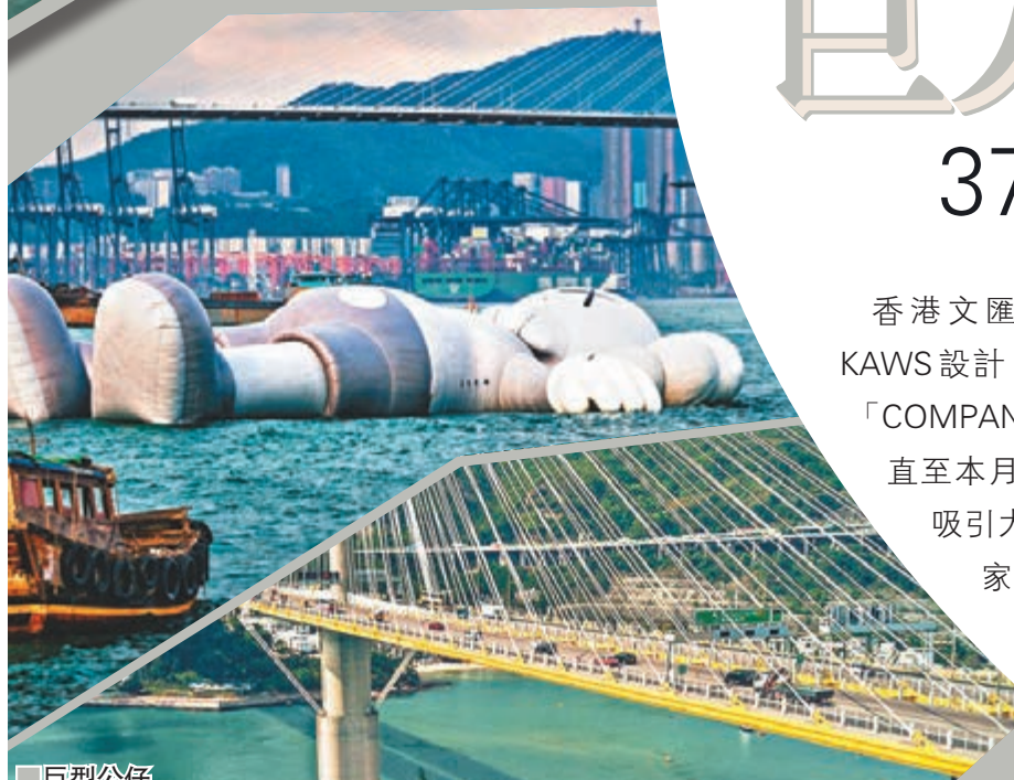
巨型公仔從青衣碼頭出發。