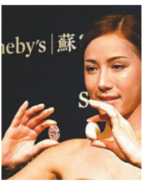
蘇富比春拍88.22卡拉巨鑽,大小與雞蛋相似。

香港文匯報訊(記者 殷翔)稀世巨鑽亮相香港。估值約1億港元的非洲博茨瓦納88.22卡拉無瑕巨型白鑽,將於下月2日在香港蘇富比「瑰麗珠寶及翡翠首飾拍賣春拍」會上拍賣,拍賣史上只出現過三顆逾50卡拉橢圓形巨型白鑽。蘇富比表示,能切割出80卡拉鑽的原石千古難求,這類巨鑽的原石重達242卡拉,由世界屈指可數的頂級大師,經數月不懈切割及打磨而成。 蘇富比昨日在記者會上表示,稀世巨鑽自古為皇室及權貴珍藏,時至今日仍令珠寶藏家、鑑賞家趨之若鶩。這顆88.22卡拉D色無瑕Type Ila橢圓巨鑽,成色、淨度及切工均完美無瑕,估價8,800萬至1億港元。Type Ila指化學成分最純淨的鑽石類型,只含極為微量甚至不含氮元素,透明度極佳,在所有鑽石中少於2%。