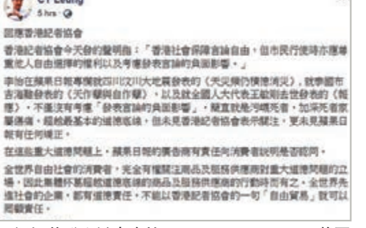
梁振英發文譴責李怡。fb截圖

香港文匯報訊(記者 鄭治祖)《蘋果日報》專欄作者李怡日前公然污衊逝者,竟指港區全國人大代表王敏剛病逝是「報應」,引起社會各界的公憤。全國政協副主席梁振英一連幾日在網上發文譴責李怡罔顧道德、毫無良知,昨日更貼出李怡污衊去年泰國布吉海難逝者「自作孽」的文章,奉勸廣告商勿堅持在《蘋果》賣廣告,重視自身的道德責任。網民積極響應,紛紛表示有良知的人都應該罷買「毒果報」。 香港記者協會昨日發聲明稱,極度關注梁振英連日在社交平台向《蘋果日報》廣告商「施壓」,聲言:「香港社會保障言論自由,但市民行使時亦應尊重他人自由選擇的權利以及考慮發表言論的負面影響。」 梁振英昨日在facebook發文回應,指責記協罔顧責任。他表示:「李怡在《蘋果日報》專欄就四川汶川大地震發表的《天災仍積德消災》,就泰國布吉海難發表的《天作孽與自作孽》,就全國人大代表王敏剛去世發表的《報應》,不僅沒有考慮『發表言論的負面影響』,簡直就是污衊死者,加深死者家屬傷痛,超越最基本的道德底線,但未見