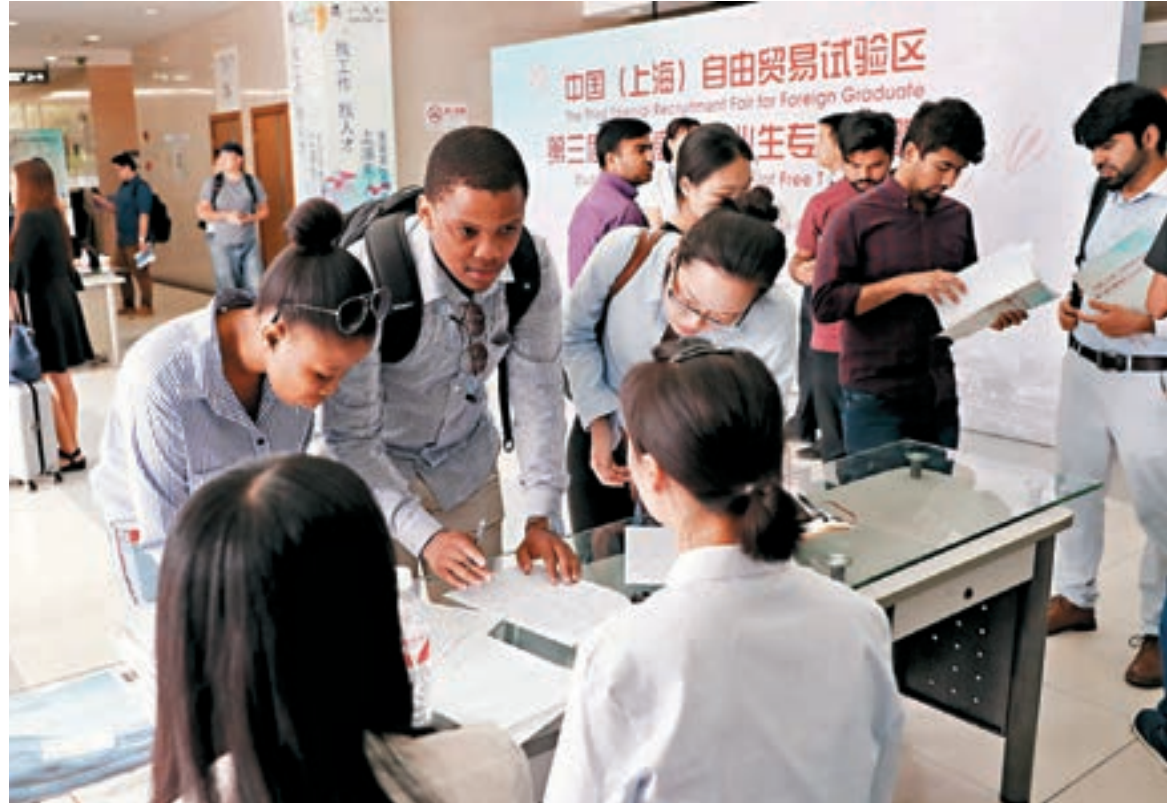
上海科改「25條」允許持有永久居留身份證的外籍人才擔任新型研發機構法定代表人,牽頭承擔政府科研項目。圖為去年上海舉行外籍人才專場招聘會。資料圖片

另外,吳清還表示,要以在上交所設立科創板並試點註冊制為契機,支持優質科創企業上市。上海將進一步深化金融中心、科創中心的聯動,進一步做好「蓄水池」服務工作,推動一批符合條件的科創企業能夠上市,同時也為科創板培育源源不斷、優質上市資源等。