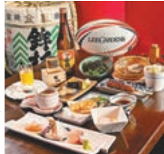
■權八居酒屋特色套餐

身(深海池魚皇、真鯛、帆立貝)、壽司(火炙石口魚邊、海膽)、海鮮茶碗蒸、權八汁燒免治雞肉棒配宮崎溫泉玉子、天婦羅(車海老、宮崎番薯、日本南瓜)、權八手打冷蕎麥麵及椰汁南瓜白玉子等，同時，惠顧任何食品，也即可以優惠價HK$7換購精選酒乙杯(原價HK$128)。