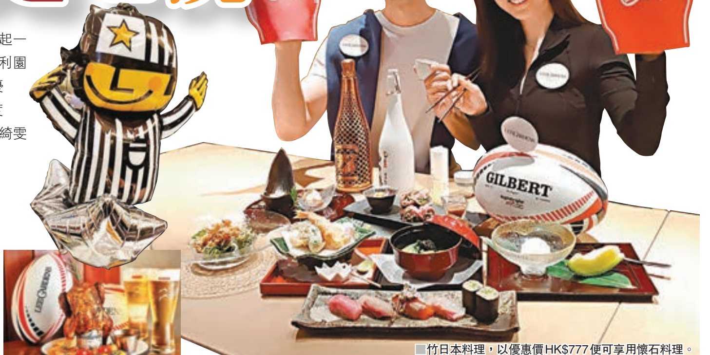
■日本料理，以優惠價HK$777便可享用懷石料理。

欖球賽即將開鑼，由今個星期六(3月23日)開始，至4月7日期間，利園區特別攜手超過15間商戶為一眾球迷舉行「Sevens Food Festival」，如日本料理、權八居酒屋、HABITU table、莊館、十里洋場、安南、梨花園、樂天皇朝、BRICK LANE、Reserva Iberica等都推出各式各樣的特色套餐及優惠。