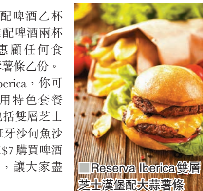
■Reserva Iberica雙層芝士漢堡配大蒜薯條

同時，在Reserva Iberica，你可以優惠價HK$328享用特色套餐(原價HK$416)，包括雙層芝士漢堡配大蒜薯條及西班牙沙甸魚沙律，以及以優惠價HK$7購買啤酒乙支(原價HK$88)，讓大家盡情歡度欖球狂熱。