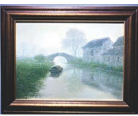
《靜靜的小河》，布面油畫，2016年