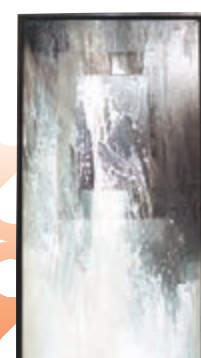
韓氏作品《一躍》是以巴西伊瓜蘇瀑布為創作靈感

展覽詳情： 日期：由即日起至6月9日 時間：星期二至星期日 上午11時至下午6時 地點：亞洲協會香港中心麥禮賢夫人藝術館