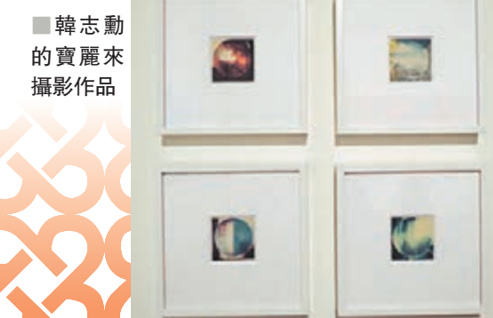
韓志勳的寶麗來攝影作品