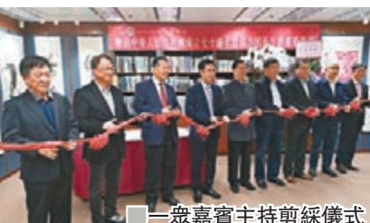
一眾嘉賓主持剪綵儀式