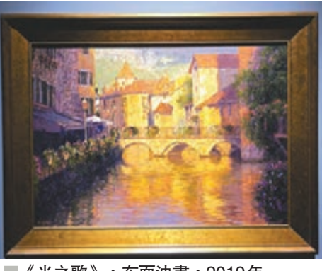
《光之歌》，布面油畫，2019年