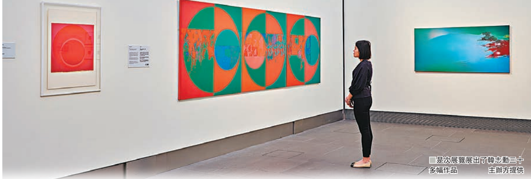
是次展覽展出了韓志勳三十多幅作品 主辦方提供