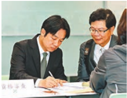
■昨日,賴清德前往民進黨中央黨部登記,並繳交登記費及民調費。 中央社

至於兩人誰的贏面更大,張文生指出,賴清德代表了台灣社會所謂的極端「台獨」政治勢力,得到了某些「急獨」勢力的支持,但這些勢力在綠營內部是很小的一股力量;而蔡英文得到了黨內大部分派系的支持,如新潮流系、蘇(貞昌)系等。在這樣的情況下,賴清德的對手不僅是蔡英文一個人,還包括她背後一大堆黨內政治勢力。因此賴清德想要「出線」恐怕不太容易。