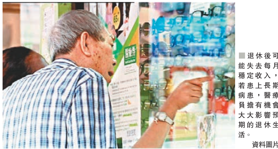
退休後可能失去每月穩定收入，若患上長期病患，醫療負擔有機會大大影響預期的退休生活。

根據資料，現時約八成住院病人是65歲以上人士。考慮到退休後可能失去每月穩定收入，若患上長期病患或重疾，醫療負擔有機會大大影響預期的退休生活。由此可見，醫療保險於退休理財而言甚為重要，可算是銀髮理財的重要基石。