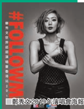
■鄭秀文2019年演唱會海報

演唱會將於今年7月12日至16日、18至21日、23及24日，在紅磡香港體育館舉行，票價為港幣$980、$680、$380，4月4日起指定信用卡客戶優先訂票。為免招致不必要損失或誤會，請歌迷經正確途徑購票，以及關注官網消息。