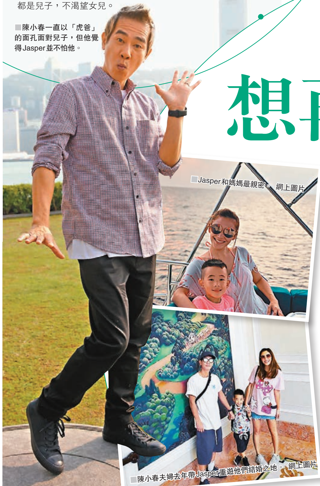
■Jasper和媽媽最親密。網上圖片