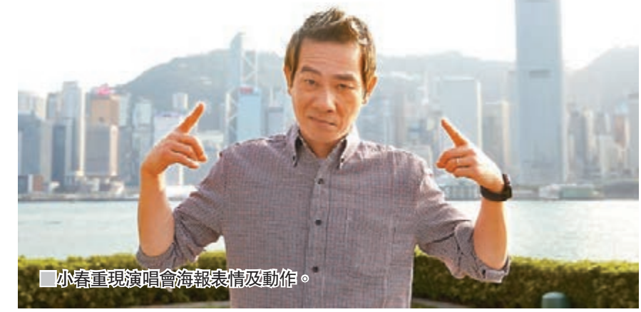
■小春重現演唱會海報表情及動作。

各地，卻始終沒有在香港舉辦，說到有粉絲詢問為何不在香港本土開騷，小春坦言早前有一定的壓力，「自己會考慮，會不會有人來看啊？」但是其後還是決定只做「前鋒」，除了表演以外的事情都全權交給工作人員。