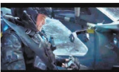
■古天樂駕駛高科技戰機。