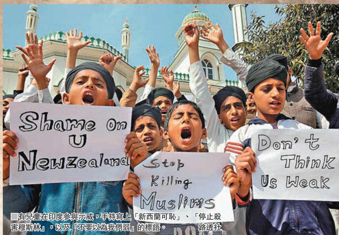
有兒童在印度參與示威，手持寫上「新西蘭可恥」、「停止殺害穆斯林」，以及「不要以為我們弱」的標語。