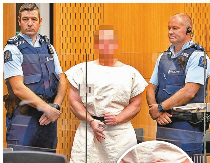
塔蘭特出庭時展示白人至上主義的倒轉OK手勢。

在新西蘭基督城兩間清真寺大開殺戒的澳洲白人槍手塔蘭特，昨日在當地提堂，他身穿白色囚衣及扣上手銬，由兩名庭警押上法庭，聽取控罪時木無表情，但卻做出象徵支持極右白人至上主義的倒轉OK手勢，顯得毫無悔意。