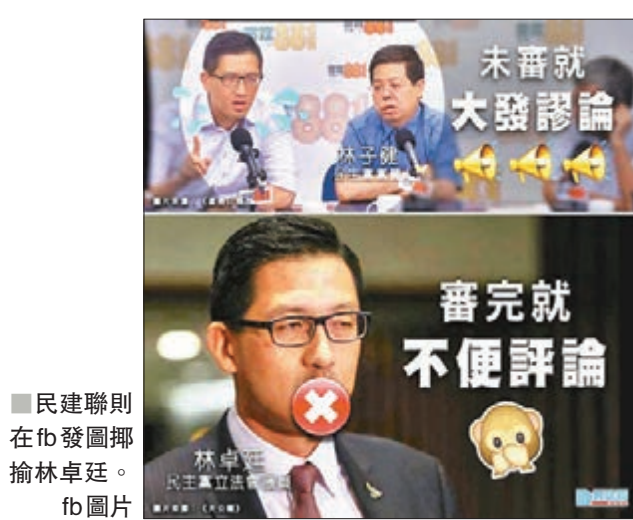
民建聯則在fb發圖揶揄林卓廷。