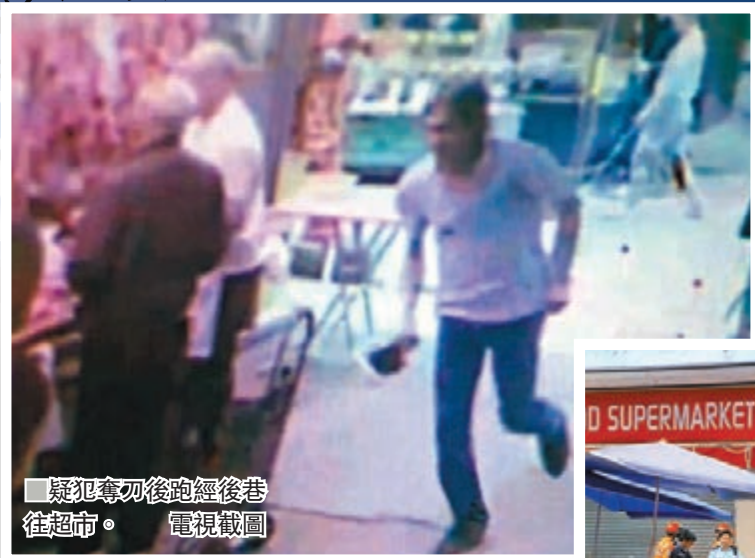
疑犯奪刀後逃往超市。電視截圖