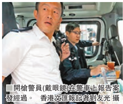
開槍警員(戴眼鏡)在警車上報告案發經過。

至於遭疑犯襲擊受傷的超市男經理及受驚不適女職員，昨晚仍在廣華醫院留醫，其中經理情況穩定。據悉受傷經