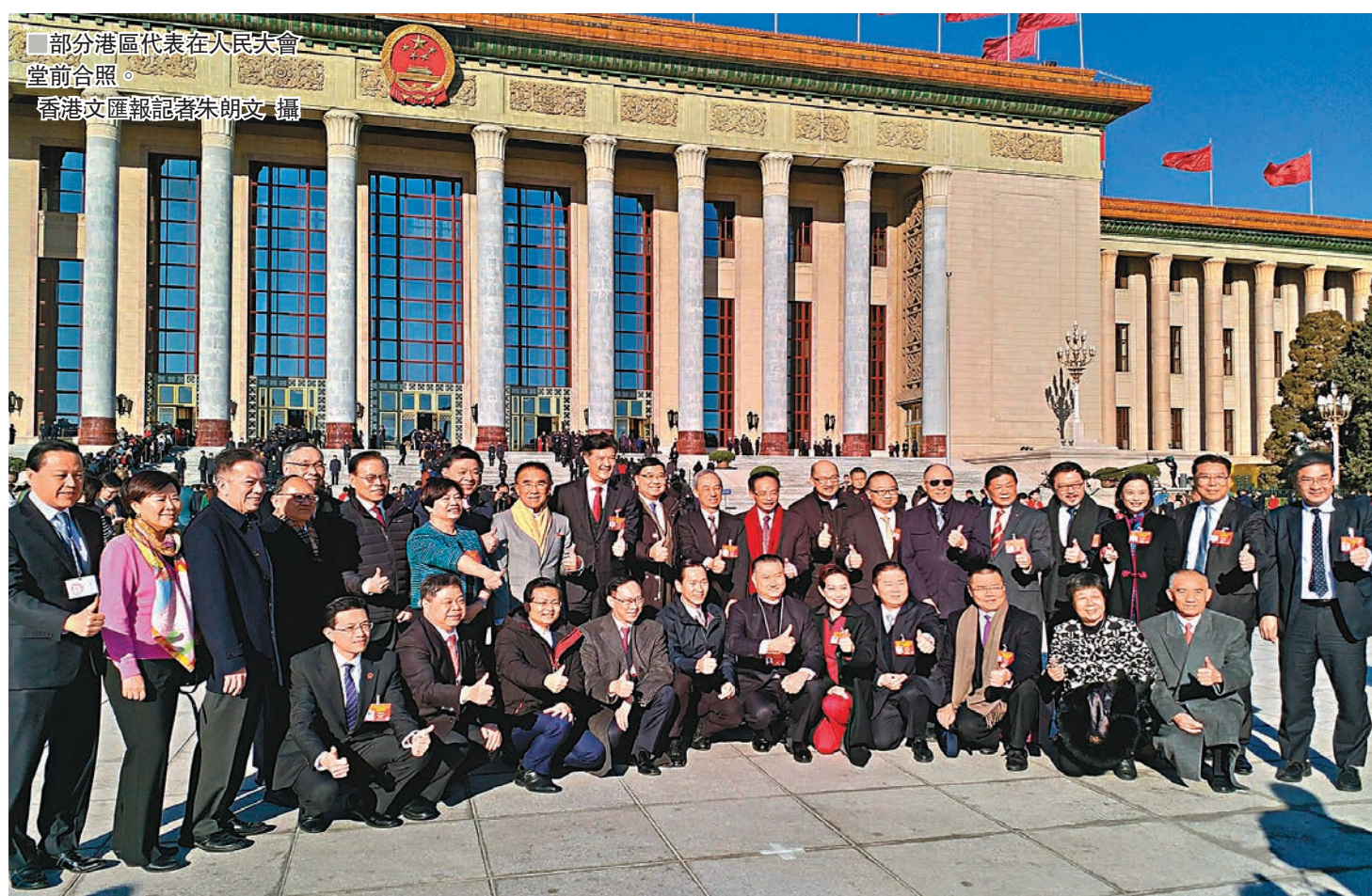
部分港區代表在人民大會堂前合照。

香港文匯報訊(記者 朱朗文 兩會報道)十三屆全國人大二次會議昨日閉幕。多名港區全國人大代表總結今年會議時形容,代表踴躍發言,「幾乎每次會議時間都不夠用。」各代表對國家過去一年取得的成績、在新年在多方面推行惠民政策均感到十分鼓舞,特別是昨日表決通過的《外商投資法》,更是對外宣示國家堅持對外開放,令外商更安心投資。他們也表明回港後會通過座談等形式,將兩會精神傳遞香港各界,特別是年輕人,又會組織青年到內地考察交流,促進香港融入國家發展大局。