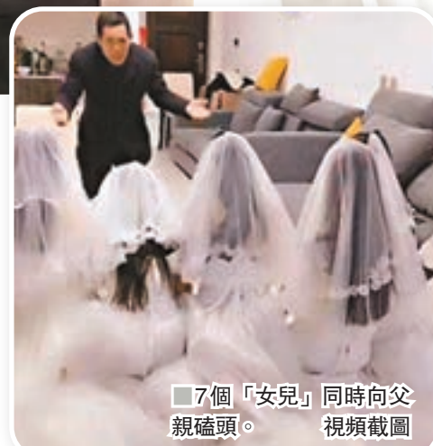
7個「女兒」同時向父親磕頭。視頻截圖