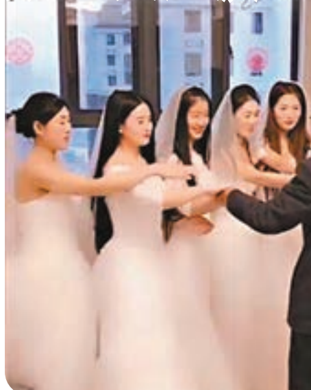
7個「女兒」與父親拉手。視頻截圖