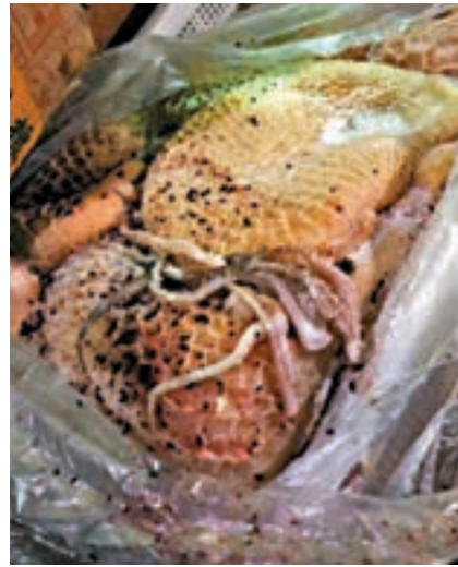
被曝光的發霉變質食品。

事發後，當地相關部門組織安全放心的食材供應，保障學生昨日正常用餐，並對食品製作過程進行監督。涉事學校立即終止與原食品供應商——四川德羽後勤管理服務有限公司的合作，在政府部門和家長的監督下，重新確定食品供應商，並着手建立由家長參與的食品安全監管長效機制。溫江區衛健局組織醫生也到校現場諮詢，對身體出現異常的學生安排體檢。