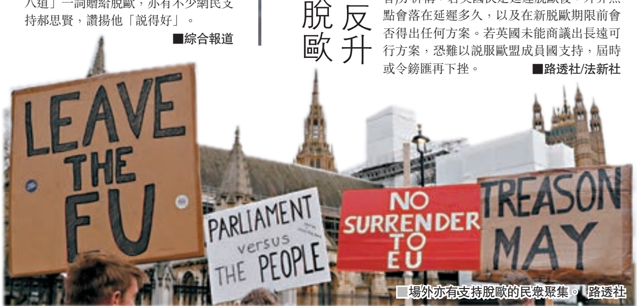
場外亦有支持脫歐的民眾聚集。