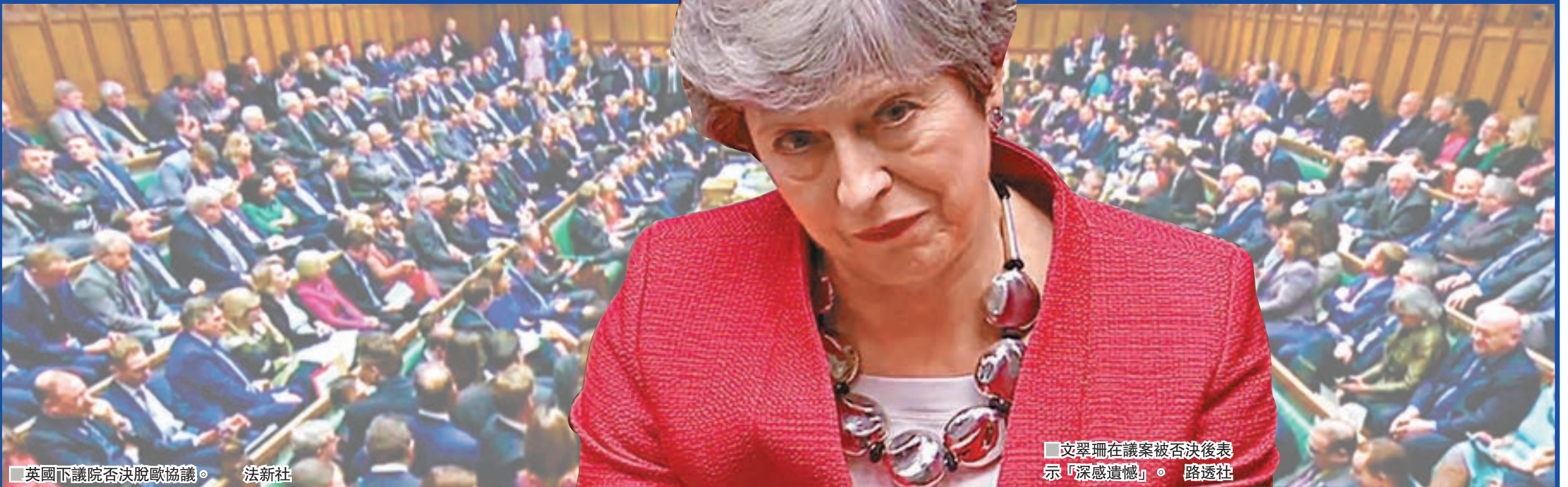
英國下議院否決脫歐協議。法新社