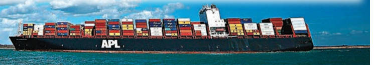
英國政府宣佈應對無協議脫歐的關稅政策。

但為保護生態環境，政府會於北愛與愛爾蘭邊界以外地區設置檢查站，檢查從非歐盟地區進入英國的動物及動物製品，抵達英國前亦需預先申報。 綜合報道