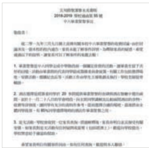
永光書院昨發通告解畫。學校網頁文件截圖

五旬節聖潔會永光書院最近計劃舉行中六畢業生聚餐，活動於九龍香格里拉酒店舉行，出席學生每人收費980元，不出席學生亦要支付350元，用以「宴請老師和購買紀念品予學校之用」。 學校在活動通函中更提到：「根據教育局指引，凡於本學年領取全額書簿津貼、領取綜合社會保障或家境清貧的中一至中六學生，均有資格申請全方位學習基金資助，以減免本活動部分所需費用。」 消息傳出後引起社會熱議，有人批評謝師宴費用太高，亦有人不滿學校要求不出席學生仍須繳交費用。