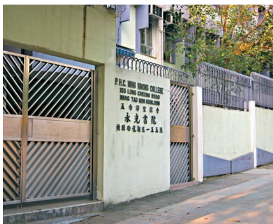
涉事的五旬節聖潔會永光書院。圖為學校外觀。資料圖片