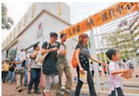
名校林立的九龍城41網只有56.9%學生獲派首三志願。資料圖片

香港文匯報訊(記者 高鈺)近年小一適齡人口波動，對學校收生及家長選校帶來衝擊。教育局近日發佈2018年度《小一入學報告書》，載列了去年全港官津小學收生數據。其中在自行分配學位階段，多達235所小學用盡「世襲位」，佔總數51.9%，較之前兩年激增。而分區統一派位方面，不同校網成功率參差，最低的九龍城41網只有56.9%學生獲派首三志願，最高的大嶼山98網則達95.9%。 最新的《小一入學報告書》顯示，2018年度共有56,648名升小生經教育局小一入學統籌辦法獲分配453所小學的學位。