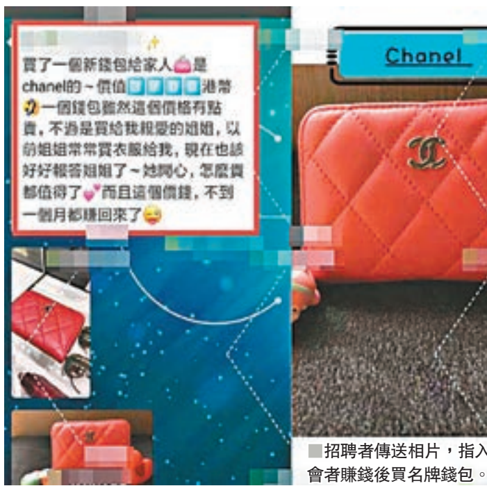
招聘者傳送相片，指入會者賺錢後買名牌錢包。

警方發言人表示，求職騙案由2016年的51宗上升至2018年的150宗，升幅接近兩倍；當中涉案金額亦由2016年7百萬元增至2018年的17.4百萬元。