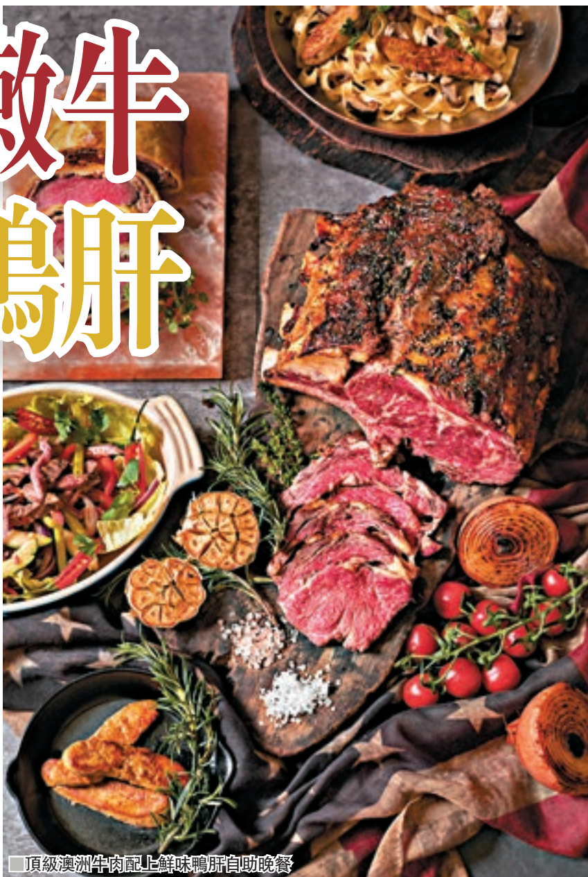
頂級澳洲牛肉配上鮮味鴨肝自助晚餐

置身於寬敞的Bistro on the Mile內，超過二十多款的鮮嫩澳洲牛肉菜式為你源源不絕地奉上，包括有不同部位的頂級牛肉燒烤如牛肋條、西冷牛扒及側腹牛扒，以及威靈頓牛柳、燒美國頂級牛肉、燒肉眼牛肉澳洲和牛漢堡、韓式燒牛排骨、金菇和牛牛肉卷、黑椒牛肉片、牛尾雞菜啫喱杯、火炙和牛壽司、燒牛肉沙律配日本冬菇露筍，還有一系列的鴨肝為主的前菜及熱