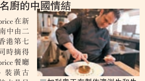
加利奧正在製作澳洲生和牛肉韃拌法國鮮蝦配特級魚子醬。

香港的法國餐廳Caprice在新出爐的2019米芝蓮指南中由二星上升至三星，成為香港第七間米芝蓮三星食府，同時摘得「黑珍珠」二鑽。Caprice餐廳環境受到各方讚賞，裝潢古典、格調高雅，懸掛的水晶吊燈富麗華美，在這裡就餐，維多利亞海港美景盡收眼底。米芝蓮指南評價，Caprice餐廳用各種高級食材輔以精湛調料技巧的法國菜式，每一道菜都將味道發揮到極致，餐廳的