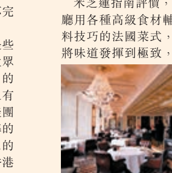
香港法國餐廳Caprice裝潢古典有格調，水晶燈襯托出法式優雅。

單選擇更是琳琅滿目。「黑珍珠」評價，Caprice主廚對現代法式技藝的詮釋很到位，同時也加入了亞洲和法國本土的一些口味元素，服務堪稱完美。2017年主廚紀堯姆·加利奧加入Caprice，他擅長傳統法國烹飪技巧並精於菜式中多種味道的平衡。對於自己家鄉的米芝蓮指南和「黑珍珠」，他認為這是兩種不同標準的指南，但他很開心自己兩者都能獲獎。