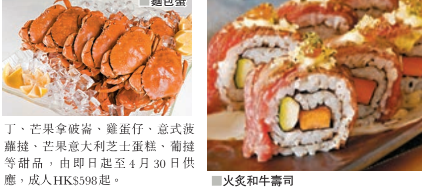
麵包蟹 火炙和牛壽司