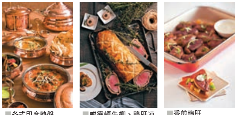
各式印度熱盤 威靈頓牛柳、鴨肝凍批及香煎鴨肝 香煎鴨肝

想享受鮮嫩多汁的頂級澳洲牛肉加上入口即溶的鴨肝？今個春日，金域假日酒店的Bistro on the Mile咖啡廳，推出肉嫩味濃見稱的澳洲牛肉及世上其中一種最矜貴的食材——油香甘腴的鴨肝自助晚餐，各種不同的牛肉滋味和口感在舌尖上交織成美味的交響樂章，為你帶來味覺視覺的享受。 文：吳綺雯