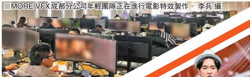
■MORE VFX成都分公司年輕團隊正在進行電影特效製作。