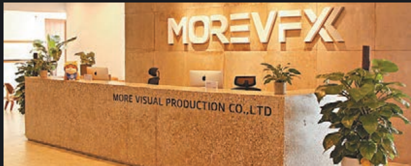
■MORE VFX成都分公司去年開業。

《流浪地球》導演郭帆表示，MORE VFX具有精明的管理團隊和運營團隊，希望在成都這片熱土上繼續發揚光大。