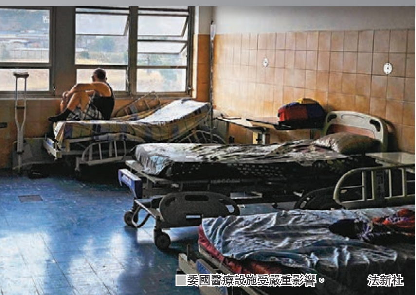
委國醫療設施受嚴重影響。

嬰兒及一名兒童在停電期間死亡。有病人形容情況可怕，批評發電機嚴重不足，院方根本無法應對。