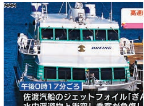
事件導致87人受傷。

日本新潟縣一艘單體水翼噴射船昨日從新潟港駛往佐渡島時，懷疑撞向鯨魚，船上121名乘客中有87人受傷，其中5人傷勢嚴重。