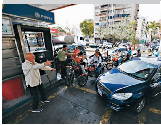
油站大排長龍。