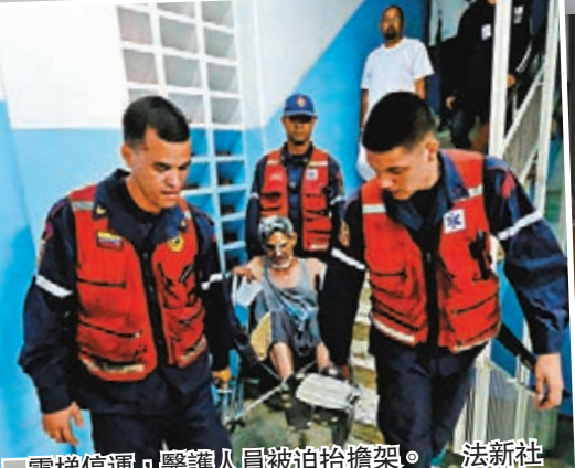
電梯停運，醫護人員被迫抬擔架。