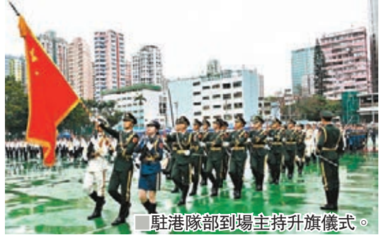
曾鈺成出席香港升旗隊總會周年檢閱禮。駐港隊部到場主持升旗儀式。

阿曾盼國歌法「原汁原味」通過 香港文匯報訊(記者 繆健詩)立法會正在審議《國歌條例草案》，一直支持立法的香港升旗隊總會昨日在周年檢閱禮上，就即場奏唱國歌和進行升旗儀式，逾千名師生參與。出席主禮的香港政策研究所副主席曾鈺成表示，立法會應認真審議並通過國歌法，令升旗儀式能有更明確的規範。 香港升旗隊總會昨日在荃灣沙咀道遊樂場舉行周年檢閱禮，並邀得駐港部隊軍樂隊及儀仗隊到場主持升旗儀式。隨着國歌奏起，在場的逾千名學生、家長和嘉賓都保持肅立，氣氛嚴肅。 曾鈺成在活動中致辭表示，香港在回歸祖國後，已通過了國旗國徽條