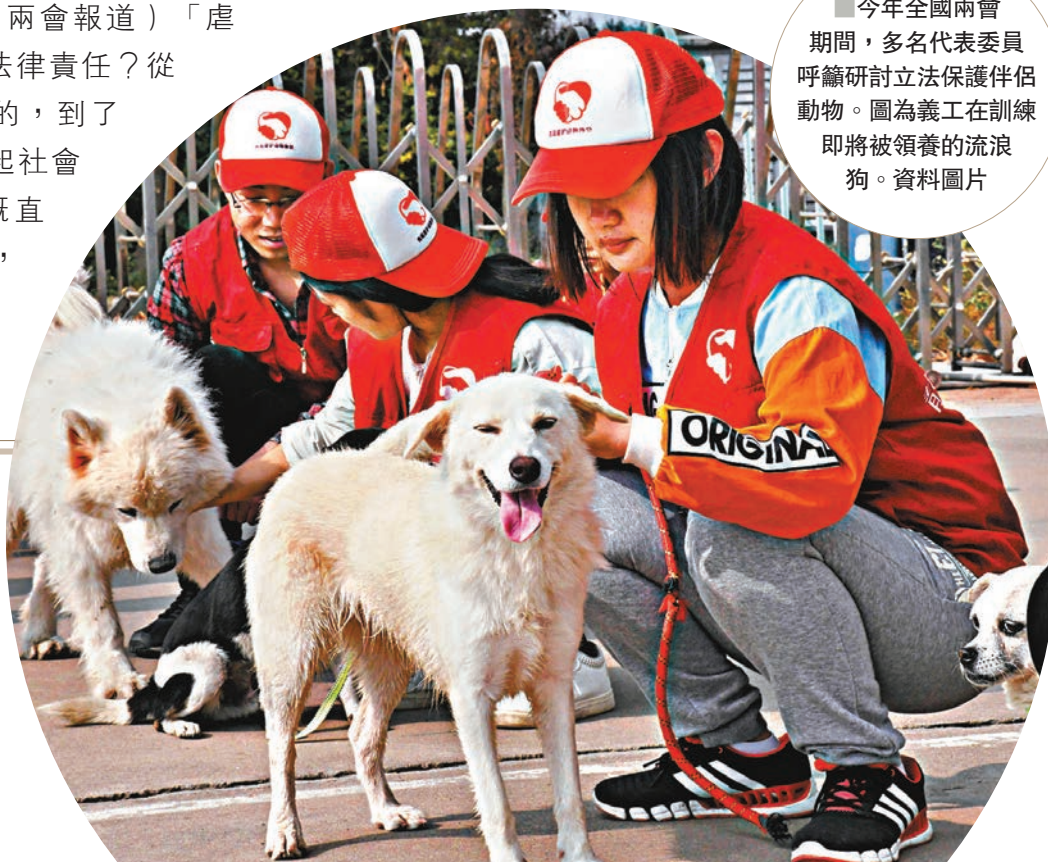
今年全國兩會期間，多名代表委員呼籲研討立法保護伴侶動物。圖為義工在訓練即將被領養的流浪狗。資料圖片