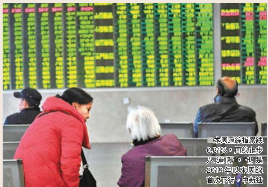
本周滬綜指累跌0.81%,周線止步八連陽,也是2019年以來周線首次下行。

香港文匯報訊(記者 章蕪蘭 上海報道)內地2月貿易數據不及預期,加上A股連續大漲後沽壓嚴重、牛市龍頭股被看空,及外圍市場走弱等不利因素共同施壓,A股在本周最後一個交易日暴跌。滬綜指狂瀉4.4%後,連續失守3,100及3,000點整數關口,近期表現強勢的券商板塊插水近9%,上演跌停潮。中證監於收市後表示,對當日市場表現不作評論,承諾將履行好監管職責,促進市場健康穩定發展。