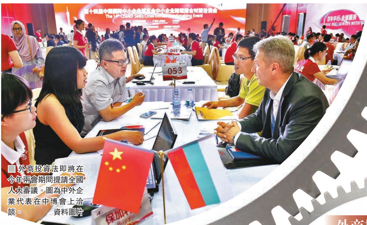
外商投資法即將在今年兩會期間提請全國人大審議。圖為中外企業代表在中博會上洽談。