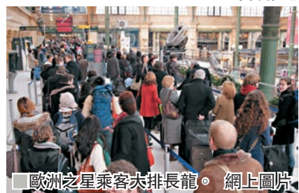
歐洲之星乘客大排長龍。