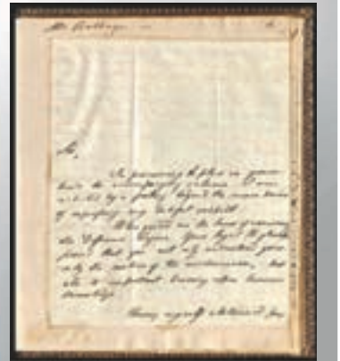
維多利亞女王信件