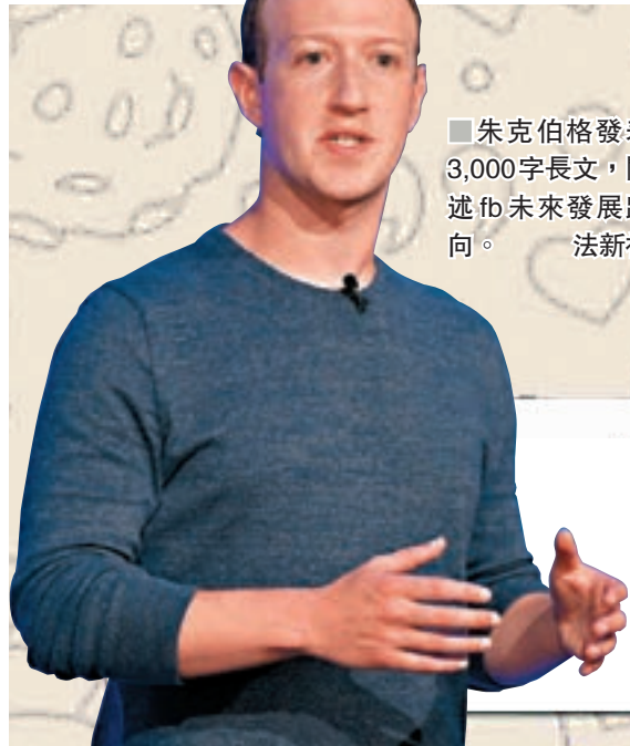
朱克伯格發表3,000字長文，闡述fb未來發展路向。