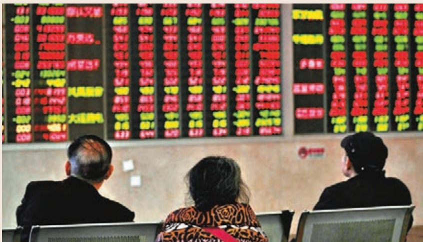
在科创板進展向好等利好下，A股氣氛急升。滬深兩市成交額昨日超過1.1萬億元人民幣，為2015年11月以來新高。

新三板企業金達萊公告稱擬向科创板發起衝擊，成為系列規則正式落地後、首家獲得董事會審議通過申請科创板上市的公司。 金達萊專注污水處理與資源化領域，業內人士分析，從市值與財務指標來看，金達萊滿足科创板上市五套標準中的多項指標。 新三板優質股或現轉板 據悉，不少新三板頭部企業似乎對科创板躍躍欲試，相關統計顯示，截至3月初，今年以來共有22家公司發佈了上市輔導公告。科创板加速落地，或已令一些新三板優質掛牌公司萌生轉板想