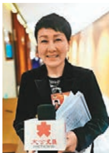
全國政協委員、演員張凱麗提倡規管管理明星八卦新聞。