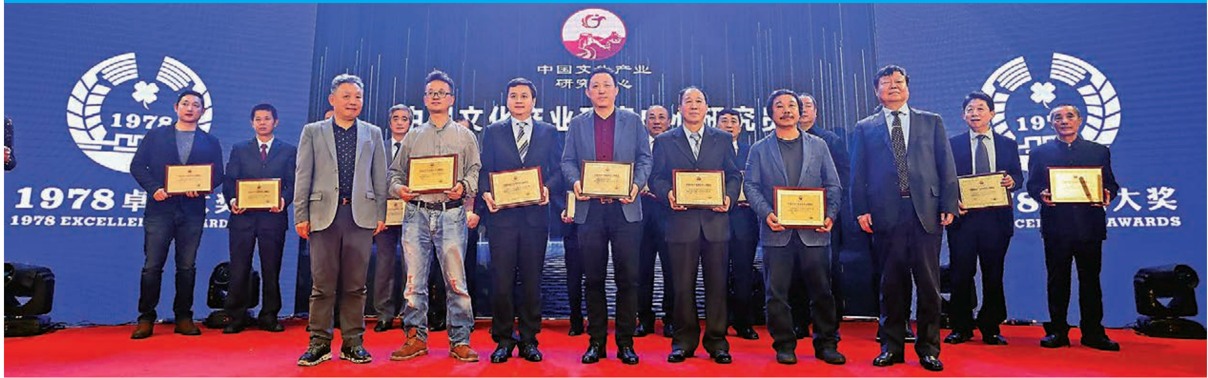
各得獎嘉賓獲獎後，於中國文化產業研究中心研究員聘任儀式上合照。

由香港大公文匯傳媒集團、濠江日報、中國文化產業研究中心及中國娛樂產業研究院等機構共同主辦「1978卓越大獎」，日前假澳門銀河悅榕莊宴會廳隆重舉行「100位改革開放文化產業領軍人物」頒獎盛典，獲獎人物代表的是中國改革開放40年的風雲變化，見證中國改革開放、迅猛發展的人物評選，該獎項自評選以來就備受矚目。獎項除了是對卓越人物的一次表彰，也是一次文化聚會，文人墨客相聚於此，相談甚歡。頒獎盛典前，港澳書畫家濟濟一堂，以筆會友，揮毫潑墨，彰顯了改革開放40年書畫藝術的成果，並於盛典中舉辦「中美文化產業峰會論壇」。