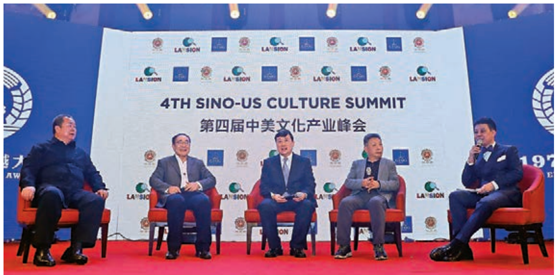
在中美文化產業峰會議題討論上，吳歡、劉江、孟凡超、陸天明就《中國文化對外合作及發展趨勢》議題發表意見。

當晚，舉辦了「中美文化產業峰會論壇」，中國香港著名作家、畫家吳歡，著名導演劉江，港珠澳大橋設計師孟凡超以及國內著名作家陸天明一同參與，就中國文化對外發展和趨勢暢所欲言，發表真知灼見，為中國文化走向世界出謀劃策，讓聽者受益良多。頒獎典禮現場精彩紛呈，笑點、淚點時而閃爍，那是領軍人物奮鬥歷程上的最難忘的時光，也帶給大眾的感動和收穫。