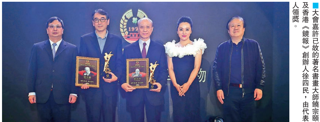
大會嘉許已故的著名書畫大師饒宗頤及香港《鏡報》創辦人徐四民，由代表人領獎。