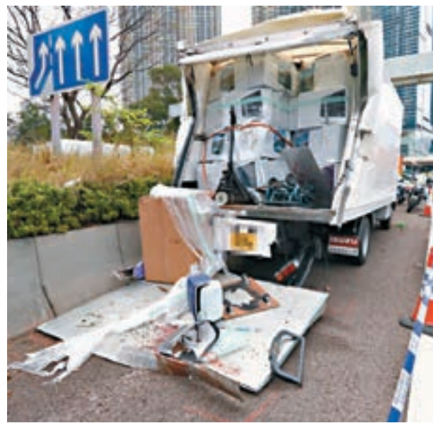
▲被撞貨車車尾凹陷，損毀的尾板留有血跡。 ▲肇事巴士車頭毀爛，車頭控制台被削下，車長拋出車外慘死(綠色帳篷)。圓圖為死者蘇國偉。 香港文匯報記者劉友光 攝 香港文匯報記者劉友光 攝