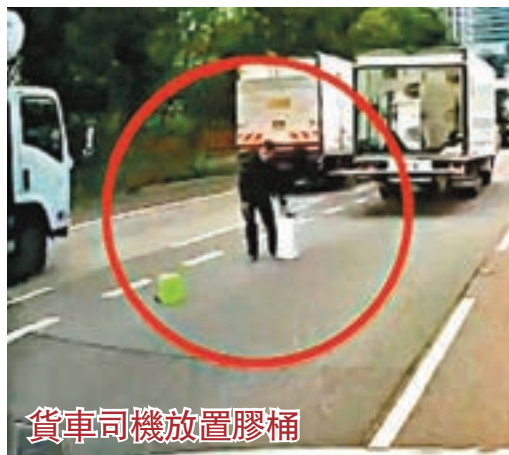
貨車司機放置膠桶