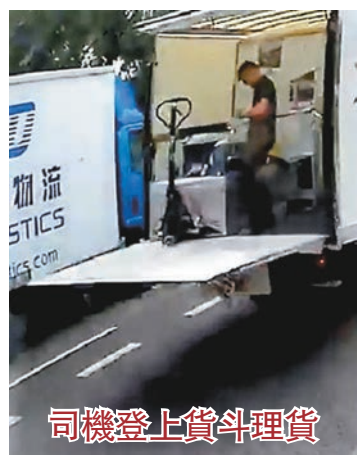
司機登上貨斗理貨