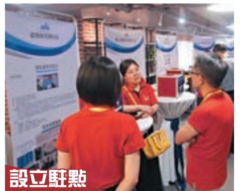
設立駐點 三地創業資源共享和對接，助青年創業少走彎路。