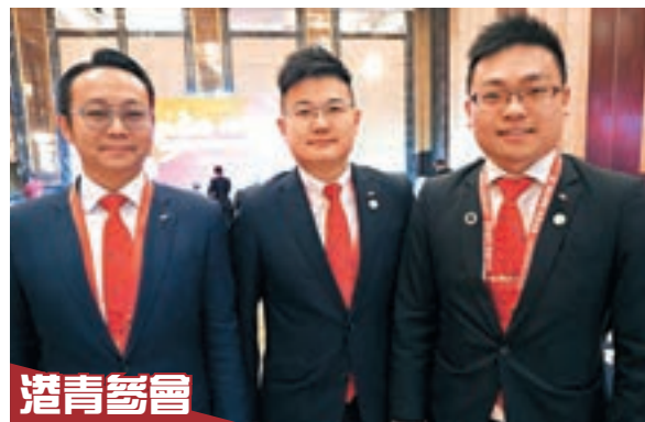
港青參會 港青組團參會，對接創業資源。