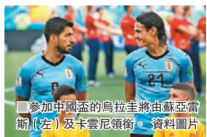
參加中國盃的烏拉圭將由蘇亞雷斯(左)及卡雲尼領銜。資料圖片