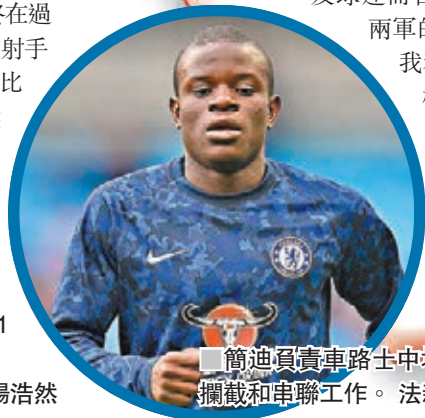
簡迪真高車路士中場的攔截和串聯工作。