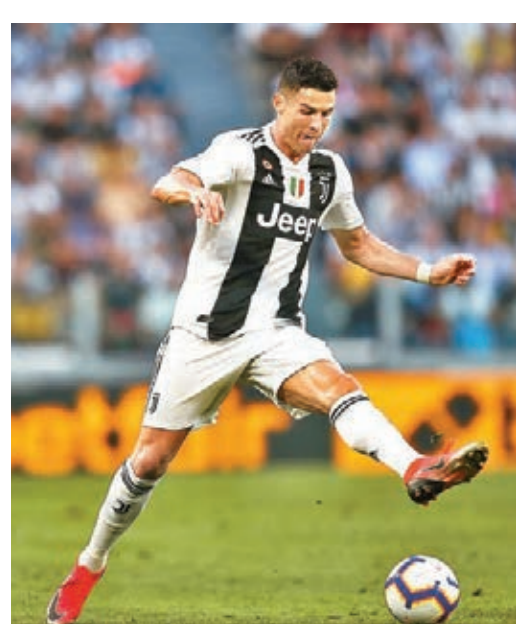
國米(灰白衫)又輸一場。