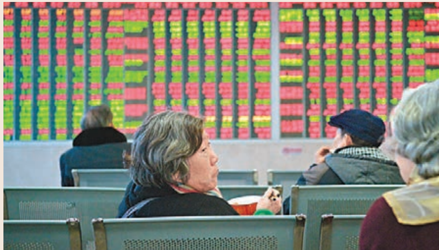
A股昨日未能持續近期上升勢頭,截至收盤,上證綜指報2940點,跌0.44%。中新社