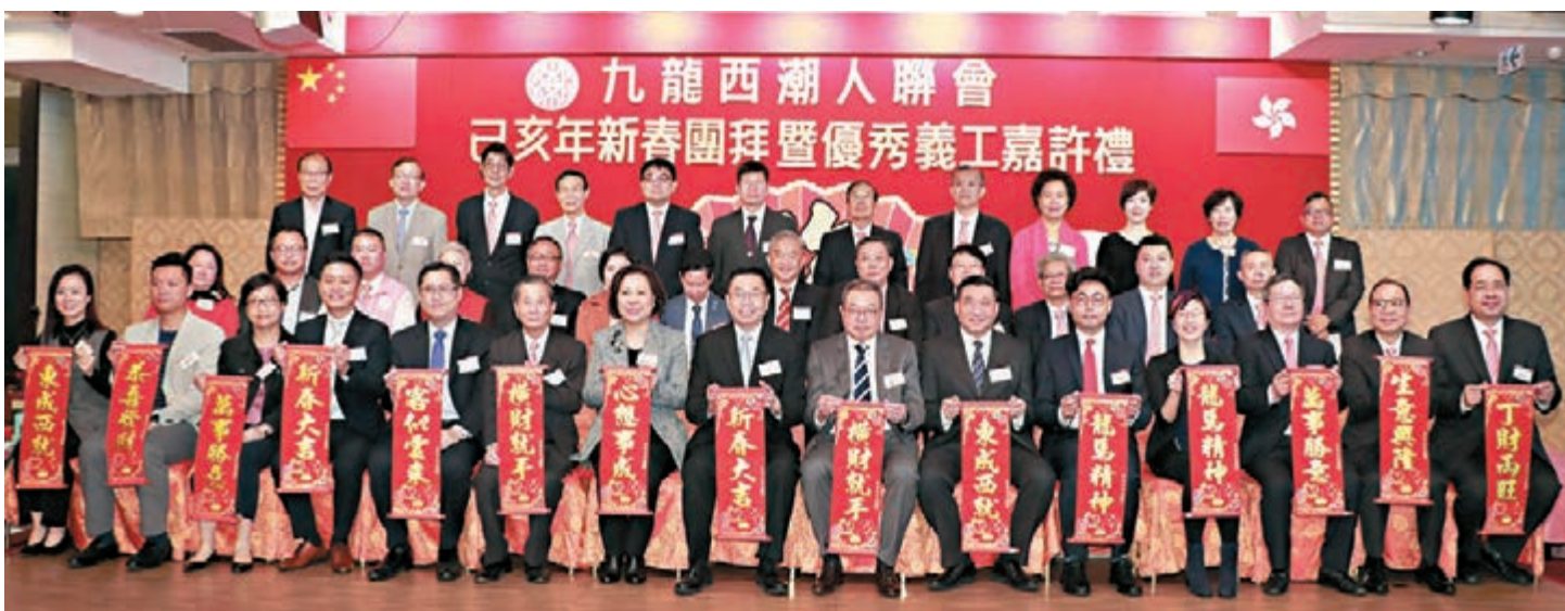
九龍西潮人聯會己亥年新春團拜暨優秀義工嘉許禮,賓主合影。