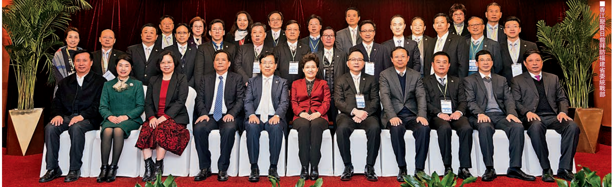
香港江聚賢日前拜訪福建省委統戰部