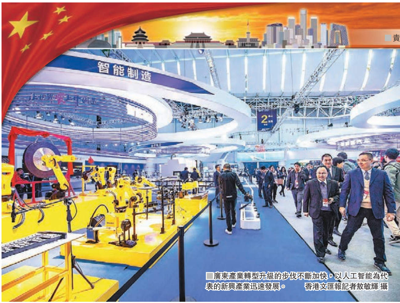
廣東產業轉型升級的步伐不斷加快，以人工智能為代表的新興產業迅速發展。

去年3月7日，中共中央總書記、國家主席、中央軍委主席習近平參加十三屆全國人大一次會議廣東代表團審議時明確表示「廣東既是展示我國改革開放成就的重要窗口，也是國際社會觀察我國改革開放的重要窗口」，勉勵廣東「繼續深化改革、擴大開放，為全國提供新鮮經驗」。一年來，在外部環境複雜嚴峻，國內需求增長緩慢等不利因素下，廣東加大改革開放力度，新材料、新能源、生物醫藥、5G研發、機器人……一系列新興產業茁壯成長。經濟大省廣東正逐漸擺脫土地、資源、人口、環境等路徑依賴，新動能不斷發展壯大。