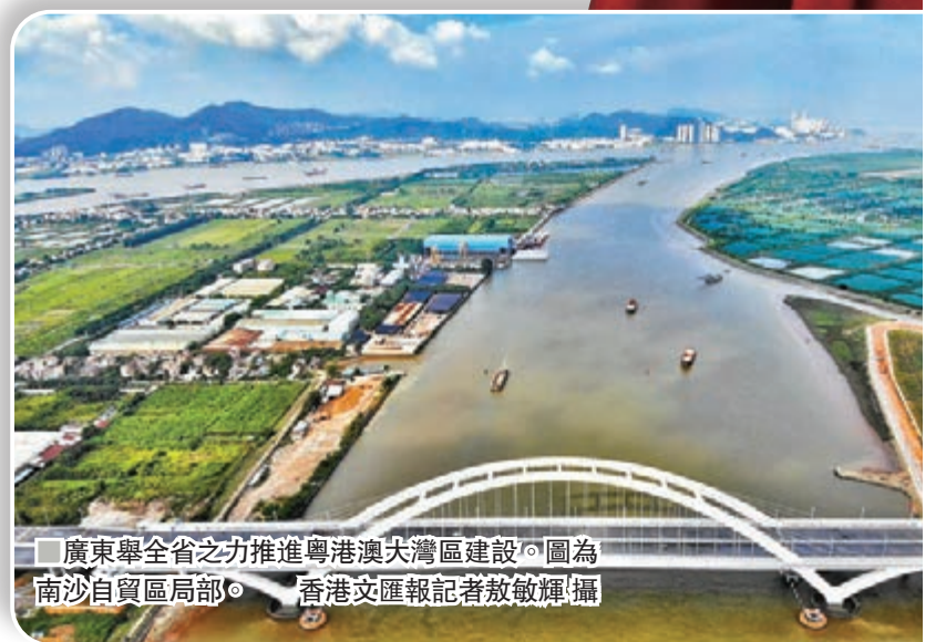
廣東舉全省之力推進粵港澳大灣區建設。圖為南沙自貿區局部。

2018年，廣東地區生產總值達9.73萬億元（人民幣，下同），同比增長6.8%，繼續保持經濟總量全國第一的位置。細分統計項可見，2018年頭10個月，廣東全省規模以上工業增加值2.59萬億元，先進製造業約佔六成，而10年前這一佔比僅一成多。「先進性」和「智能化」，是廣東培育新動能的兩大着力點。「你們能想像，一根小天線涉及多少高科技嗎？」京信通信系統控股有限公司取得近千項核心技術專利，突破了天線小型化、輕型化、一體化等難關，研發出多制式融合天線、多系統共用天線。到2015年，京信通信專利技術數量躍居全球前列，移動通信天線業務穩居全球前三，擠進100多個國家和地區的移動網絡業務。「兩年少建鐵塔45萬座，節約土地兩萬畝。」公司執行總裁卜斌說。