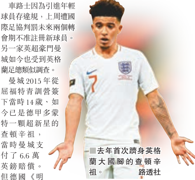
■去年首次躋身英格蘭大國腳的查頓辛祖。路透社

車路士因為引進年輕球員存違規，上周遭國際足協判罰未來兩個轉會期不准註冊新球員。另一家英超豪門曼城如今也受到英格蘭足總類似調查。曼城2015年從屈福特青訓營簽下當時14歲、如今已是德甲多蒙特一顆超新星的查頓辛祖，當時曼城支付了6.6萬英鎊賠償。但德國《明鏡周刊》稱找到內部文件，指曼城為促成辛祖加盟，還私下向辛祖的經理人支付了20萬英鎊，違反了國際足協和英格蘭足總禁止以額外利誘條件簽入16歲以下球員之相關規定。英足總日前發表聲明，將對事件展開調查。曼城方面則表示，「我們不會對曼城以及相關人士受到的攻擊發表任何評論，這種試圖損害球會聲譽的行為是有組織和預謀的。」