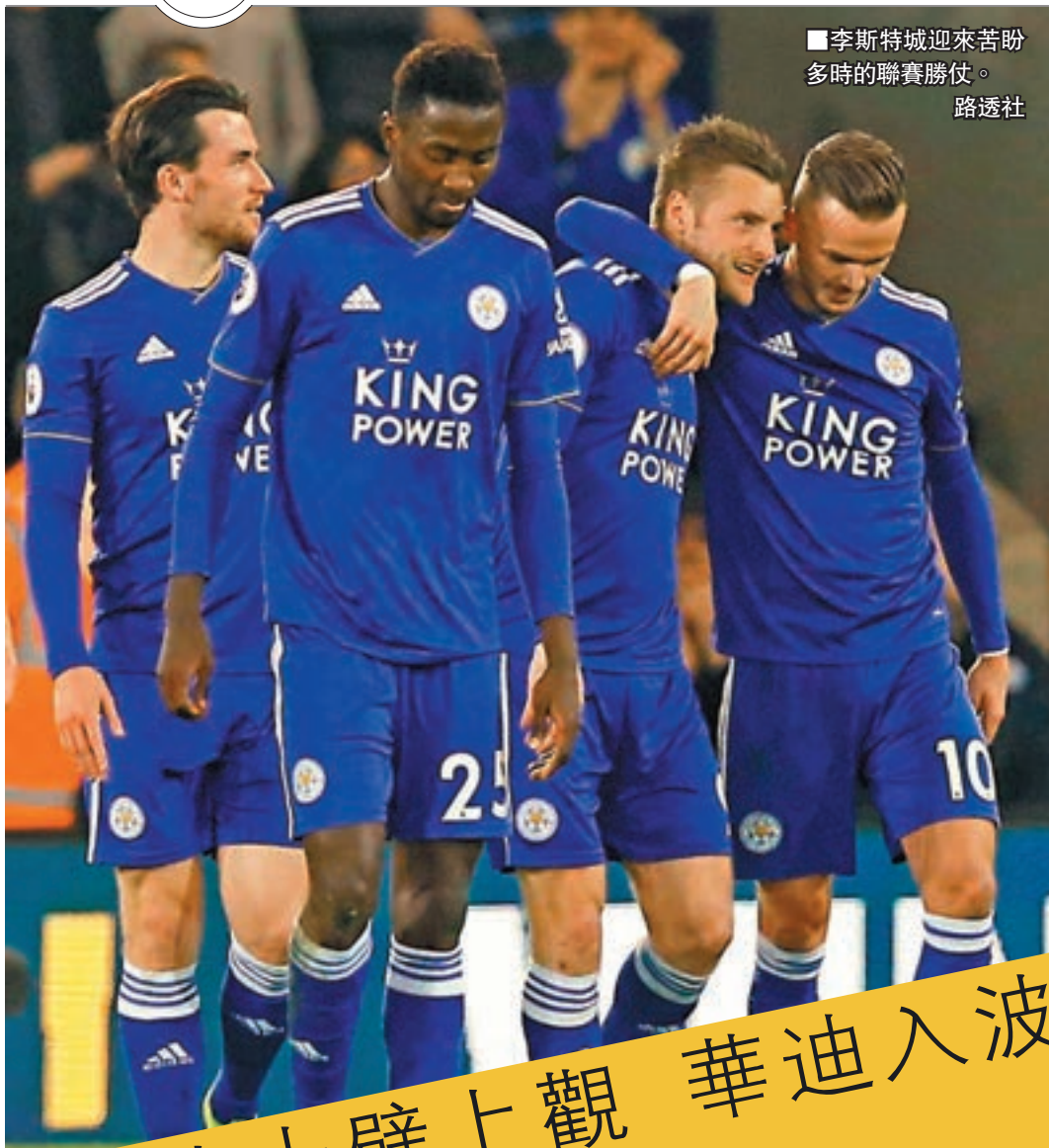
■李斯特城迎來苦盼多時的聯賽勝仗。