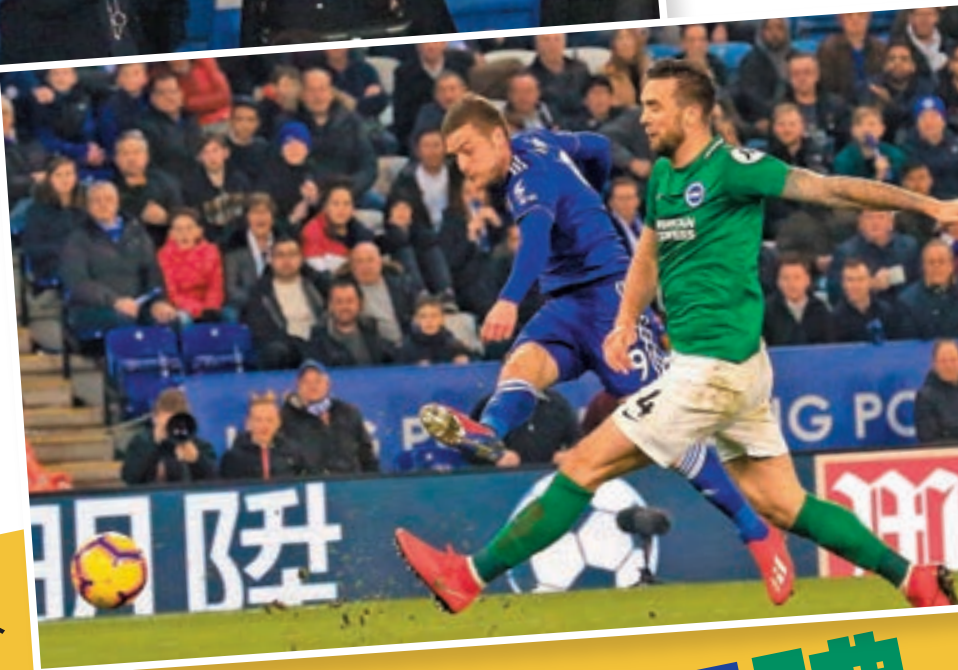
▼占美華迪(左)射入奠勝一球。