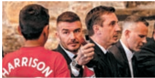
■(右一至右三)傑斯、加利尼維利和碧咸出席了夏理遜的喪禮。