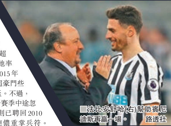
■法比安舒哈(右)幫助賓尼迪斯再贏一場。

同日英超其他三場比賽中，紐卡素主場憑藉法比安舒哈及桑恩朗達夫各建一功，以2：0擊退般尼，迎來二連捷，在積分榜升至第13位，而般尼英超8場不敗的戰績也遭終結。卡迪夫城在主場以0：3不敵愛華頓，其中基菲爾施古臣獨中兩元。哈特斯菲爾德依靠穆尼爾在91分鐘的入球主場絕殺狼隊1：0，28輪過後得3勝5和20負成績繼續墊底，這場勝利恐怕難以改變他們降班的命運。