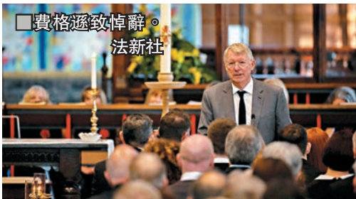
■費格遜致悼辭。