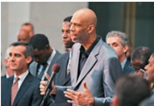
■籃球名宿渣巴決定將冠軍指環捐出拍賣。