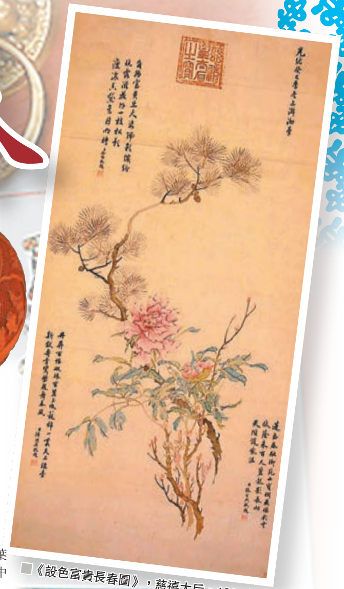
■《設色富貴長春圖》，慈禧太后，1893年。