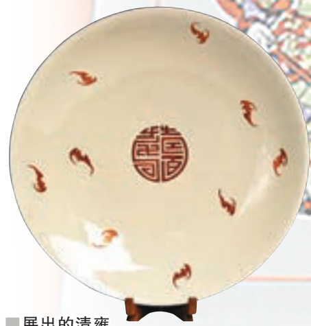
■展出的清雍正款壽紅白蝠壽紋大盤。

此外，展覽復原了清宮過萬壽節時宴飲的場景：在一張填漆描金開光坐龍宴桌上，擺着銀鍍金壽字火碗、鍍金壽字茶托、吉祥如意銀匙、福壽字銀匙、黃地粉彩萬壽無疆碗、黃地粉彩萬壽無疆盤、金地藍壽字紋杯，具有極濃的宮廷生活氣息。