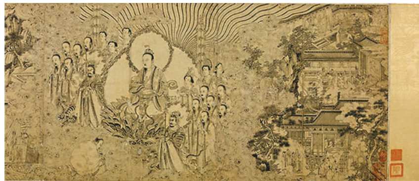
■梁楷《道君像》局部，這是翁氏書畫藏品中唯一的重要宋畫，也是唯一存世的早年梁楷工筆白描真跡。

沈周《臨戴進謝安東山圖》是其重要的青綠山水畫作，畫面左上上有兩行沈周簡短的題款：「錢塘戴文進謝安東山圖，庚子（1480）長洲沈周