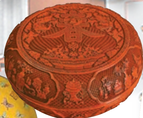
■紋飾寓意吉祥的清別紅壽春寶盒。