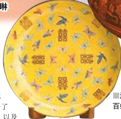
■清同治款粉彩黃地喜字百蝶大盤。