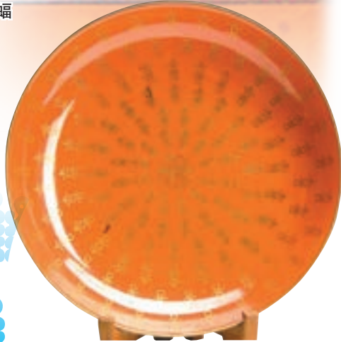
■展出的清同治款粉彩紅地喜字盤。