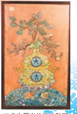
■首次展出的掐絲琺瑯粉地大吉葫蘆花卉座屏。 ■《設色牡丹圖》，黃山壽（清代）。