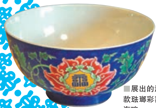
■展出的清康熙款掐絲琺瑯彩壽山福海碗。