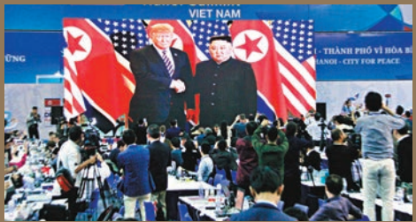
■新聞中心內記者拍下「特金」握手的電視畫面。