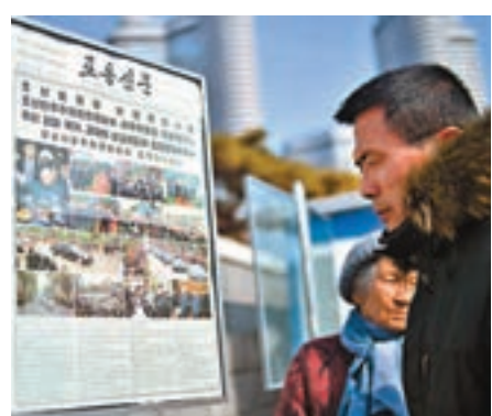
■《勞動新聞》大篇幅報道金正恩在越南河內的行程。

分析認為，朝鮮多位高官集體進行政治宣傳的情況罕見，顯示政府有意在美朝峰會前展現團結及支持金正恩。