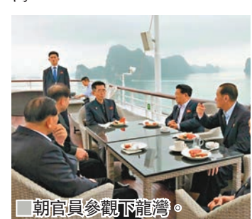
■朝官員參觀下龍灣。

普會面，外界關注他會否效法1964年訪越的已故朝鮮領導人金日成，在峰會後參觀下龍灣。