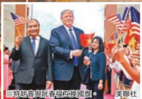
■特朗普與阮春福互換國旗。美聯社