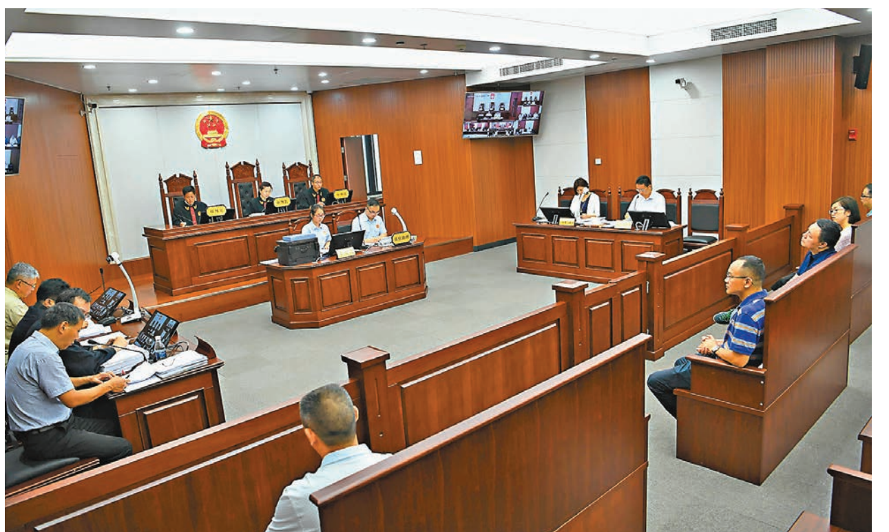
此次發佈的「五五改革綱要」中亦提出，要明確院長、庭長的權力清單和監督管理職責，健全履職指引和案件監管的全程留痕制度。圖為最高人民法院在重慶的第五巡迴法庭。

他介紹，下一步，最高人民法院將在充分總結各地經驗基礎上，進一步細化完善院長庭長權力清單和責任清單，制定出台更加精細化、更具操作性的文件，確保院長庭長依法履職，責任制落實到位。