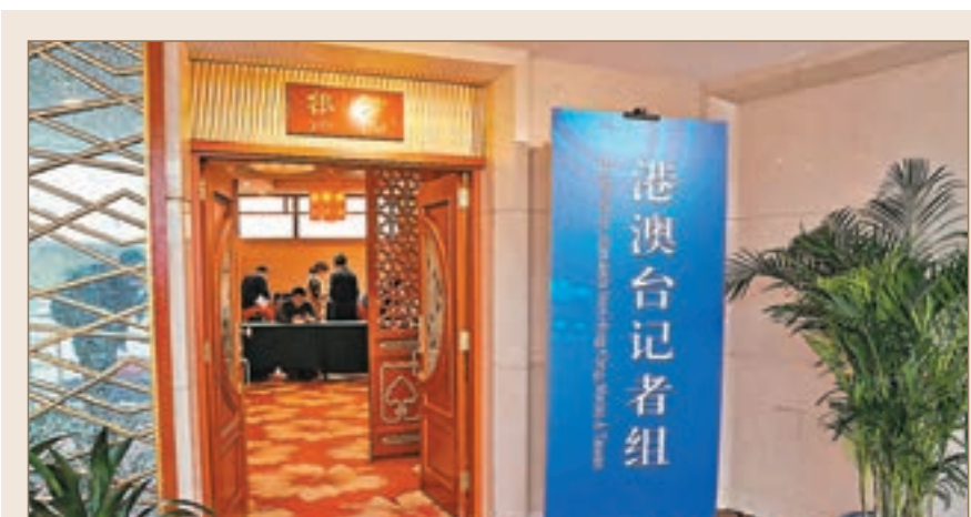
5G進兩會 十三屆全國人大二次會議和全國政協十三屆二次會議新聞中心，昨日於北京梅地亞中心正式啓用。本次新聞中心最大的亮點是首次提供了5G網絡的全覆蓋，以保證中外記者在全國兩會期間順利完成採訪、編發和傳輸稿件的任務。中國聯通公司現場工作人員介紹說，他們在現場設置了一個5G體驗區，記者可以看到用5G信號傳輸的電視節目，還可以通過VR眼鏡來觀看從人民大會堂傳輸過來的兩會VR直播節目。此外，北京天安門廣場多個5G站點正式開通，將首次服務中央廣播電視台5G+高清晰的兩會新聞報道。

CF40高級研究員張斌分析說，用國債和地方政府債替換地方平台公司貸款或其他各種形式債務，政府債務率提升的同時企業債務率將下降。因而，此舉不會提高全社會總債務率，替換後大幅降低債權利息成本開支反而會降低全社會債務負擔。