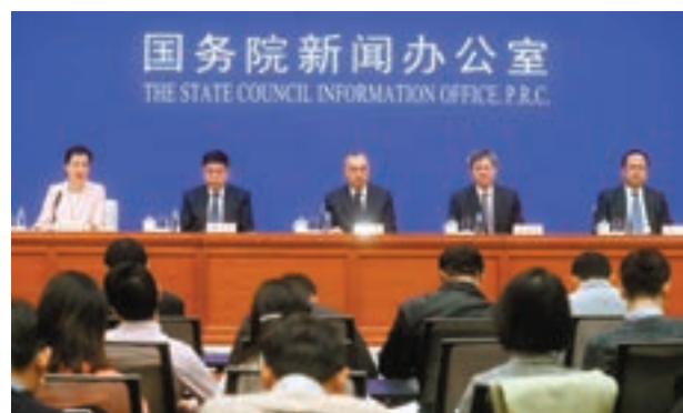
昨日，國務院新聞辦公室新聞發言人龔艷春（左一）稱，2018年國務院各部門牽頭辦理人大代表建議，政協委員提案，已全部按時辦結。

香港文匯報訊（記者 馬靜 北京報道）2019年全國兩會召開在即。官方昨日最新公佈的數據顯示，去年國務院各部門牽頭辦理的全國人大代表建議和政協委員提案已全部按時辦結。