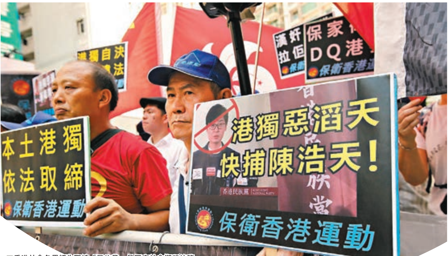
■香港社會各界認為取締「民族黨」是回應社會期望的積極做法。圖為團體舉辦反「港獨」集會。資料圖片

他指出，根據基本法第四十八條（8），即「執行中央人民政府就本法規定的有關事務發出的指令」，要求特區政府提交報告，是中央對港的全面管治權之一；特區政府根據《社團條例》作出行政決定，禁止「民族黨」運作，正是香港高度自治權的體現，故今次做法是全面管治權與高度自治權的有機結合。