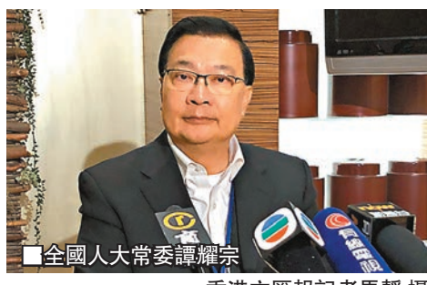
■全國人大常委譚耀宗

指，「港獨」已經超出國家可以接受的底線，特區政府依法禁止「民族黨」運作的決定，不單是關係到全港700萬市民的利益，更牽涉到國家安全問題，中央今次正式發出公函表達支持，再次顯示中央對「港獨」零容忍的態度。