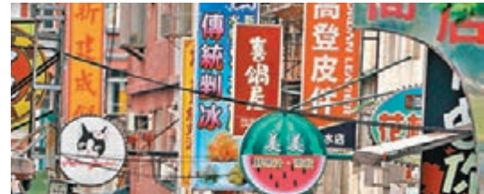
台經院稱島內上月製造業和服務業的氣候微升。圖為服務業眾多的淡水老街。

香港文匯報訊 據中評社報道，中國國民黨昨日召開首次兩岸城鄉交流平台會議。與會的15縣市代表表示，盼銷售漁農產品，並促成包機直航、郵輪停泊，兼顧「貨出去、人進來」的目標；