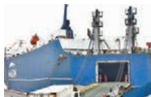
15縣市盼組團赴陸。圖為兩岸貨船。

也有與會代表說，與對岸交流最大的阻礙是台灣當局；因此，期望國民黨台灣地區「立法院」機構黨團能協助與當局