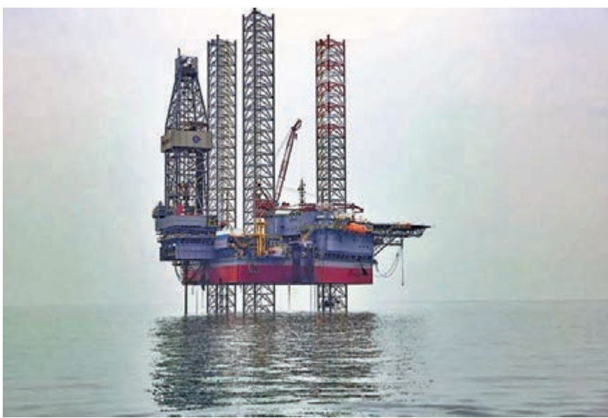
中國海油於渤海油氣田探明儲量超過一千億立方米的天然氣田，有助解決國內持續增長的天然氣需求。

2018年中國天然氣進口依存度大幅上漲至45.3%。管道和LNG（液化天然氣）是進口的主要來源。管道天然氣輸送方面依舊依靠與土庫曼斯坦之間的管道運輸。LNG方面，中國的LNG進口主要來自於澳洲、卡塔爾等國，提升國內自身產能非常必要。