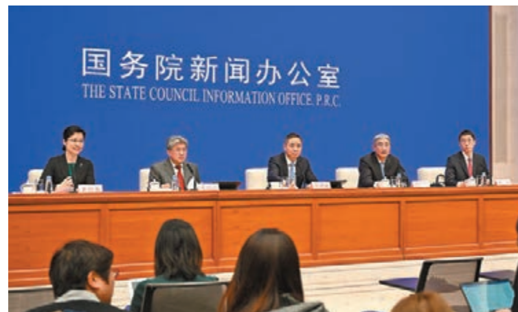
■ 昨日，國新辦舉行清理拖欠民營企業中小企業賬款階段性工作吹風會。

面，由於存在一些地方盲目鋪攤子、上項目等歷史遺留問題，加上有的地方財力受限，按期還款存在一定壓力，需要分步驟逐步研究解決；上下游企業「三角債」問題也很突出，不光是國有企業拖欠民營企業賬款，也有民營企業拖欠國有企業賬款的問題。