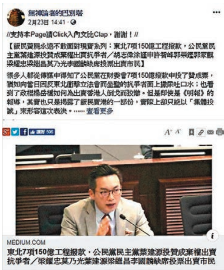
「無神論者的巴別塔」鬧爆反對派。「無神論者的巴別塔」fb截圖

雖然明知實情唔係咁，但反對派經常為咗激化矛盾揸政治本錢，而大大力唱衰政府各項政策及措施，但投票時「一絲尚存嘅理智」，就令到佢哋最終都係投贊成票，而呢種「精神分裂」就搞到佢哋班支持者無所適從。上周五，立法會財務委員會審議2019/20年度基本工程儲備基金整體撥款，最後獲得通過，公民黨3個議員原來都投咗贊成票，即刻俾自己支持者鬧爆。有人話反對派雖然唔夠票否決，但有理由連投反對票呢啲表面工夫都唔做。有人更直言，公民黨不勝都係兩頭蛇，咁嘅黨出埋呢啲政棍有咩咁出奇咁話。 ■香港文匯報記者 陳川