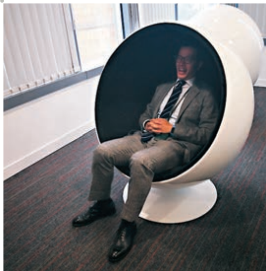
隔音的靜思角。